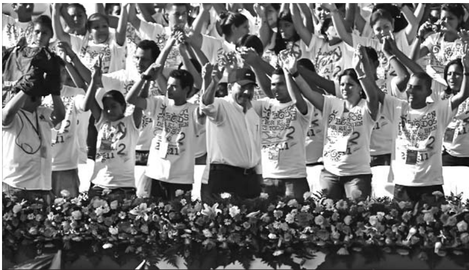
El multitudinario acto de celebración estuvo presidido por el mandatario Daniel Ortega.

El transbordador espacial estadounidense Atlantis se desacopló de la Estación Espacial Internacional (ISS) en el marco de su aniversario 33 y la última misión, comunica la Administración Nacional de Aeronáutica y del Espacio de EE.UU. (NASA). Según el plan previsto, aterrizará en el estado de Florida el próximo 21 de julio. En el marco de la misión, los astronautas probaron los componentes del sistema para suministrar combustible a los satélites en órbita y transportaron a la ISS el módulo logístico Raffaello, con más de cinco toneladas de carga. (RIA Novosti)