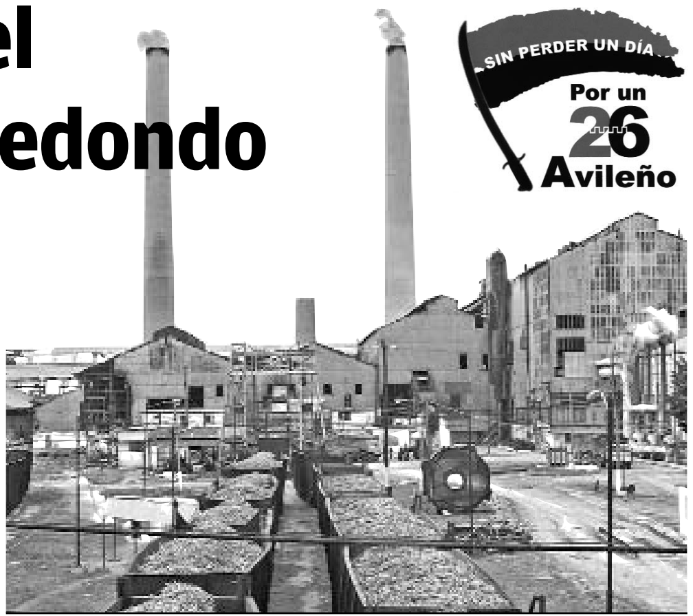
El central azucarero Ciro Redondo realizó una de las mejores zafra de la última década.