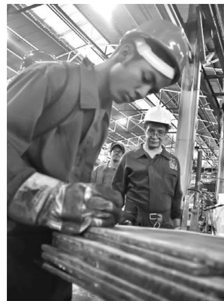
La ETP asumirá más de la mitad de los egresados de noveno grado en Las Tunas.

Tanto para esos jóvenes, como para los más de 900 que iniciarán estudios de técnicos de nivel medio, la provincia cuenta con instalaciones docentes, a las que se suman 161 aulas anexas en centros de trabajo y empresas, donde los alumnos interactúan con obreros, técnicos y especialistas, a la vez que acceden mejor a instrumentos y a otros medios, que no siempre están en la base material de la escuela.