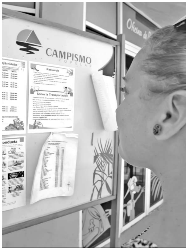
En los murales debe presentarse toda la información.