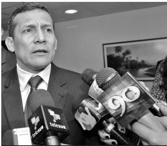
Humala intercambió con la prensa nacional y extranjera minutos antes de partir.

Por otra parte, señaló que sostuvo una conversación telefónica con el presidente vene-