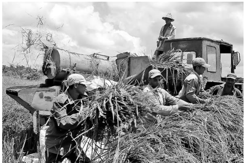
Luego de ser cortado a mano, el arroz se trilla en esta máquina comprada por los mismos usufructuarios.