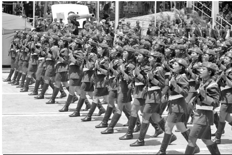
En el desfile, sobresalió la presencia de la mujer bolivariana.

Y para no dejar ni la más mínima duda de su anunciada decisión de luchar, reiteró a su pueblo: “Viviremos y