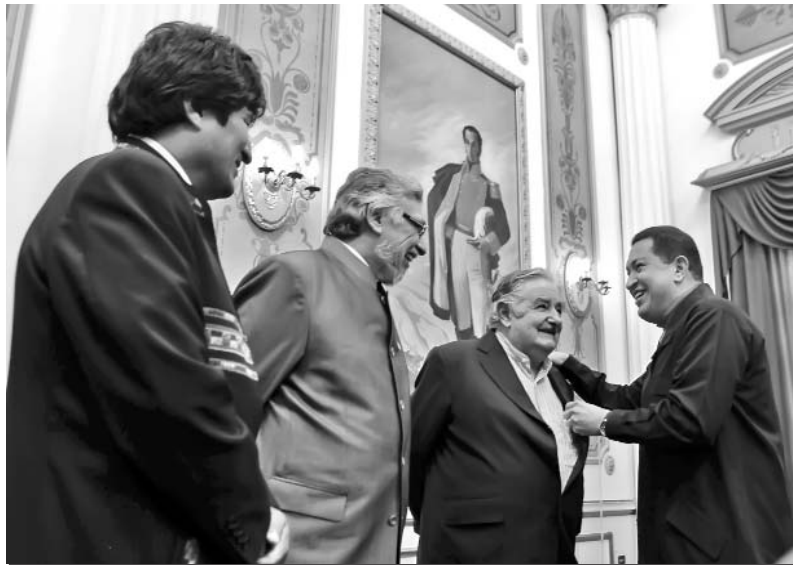
Chávez conversa animadamente con los presidentes de Uruguay, José “Pepe” Mujica; de Bolivia, Evo Morales; y de Paraguay, Fernando Lugo.

venceremos. Este es el inicio del retorno, no solo de Chávez sino de la Patria plena, de la Independencia plena, de la Patria perpetua, del pueblo de Bolívar. La construcción del más grande de los sueños que ha nacido bajo este suelo y sobre esta tierra... Hemos iniciado otra larga marcha”.