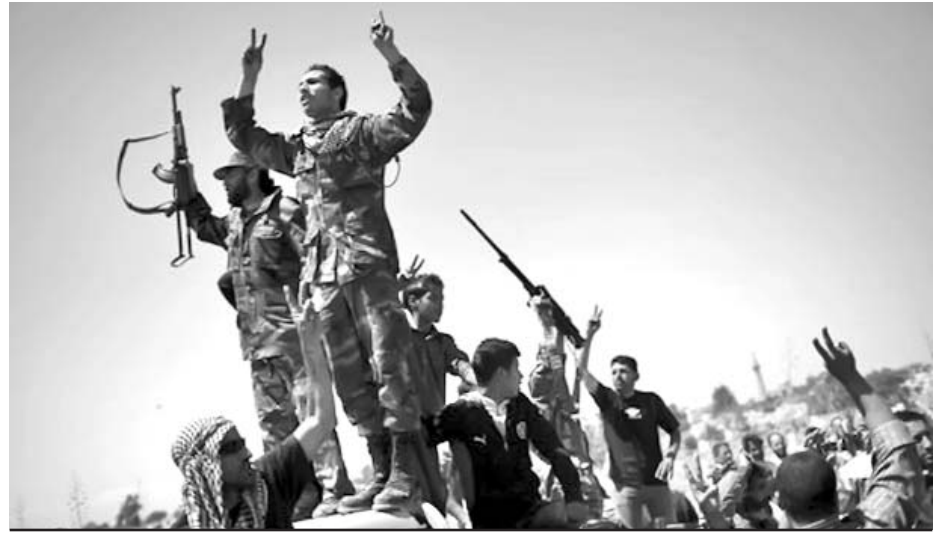
Junto al armamento enviado por Qatar fueron detenidos 11 opositores.

A pesar de que las primeras informaciones dijeron que se produjo un bombardeo de tanques israelíes, el portavoz de los servicios de emergencias, Adham Abu Selmeya, expresó posteriormente que las dos víctimas perdieron la vida a causa del ataque de la aviación.