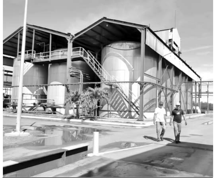
La planta recibió una reparación capital de su torre de enfriamiento y columna de destilación.

imprescindibles, toda vez que estaba observándose cierta tendencia al sobreconsumo, tanto de los índices de miel como los de combustible.