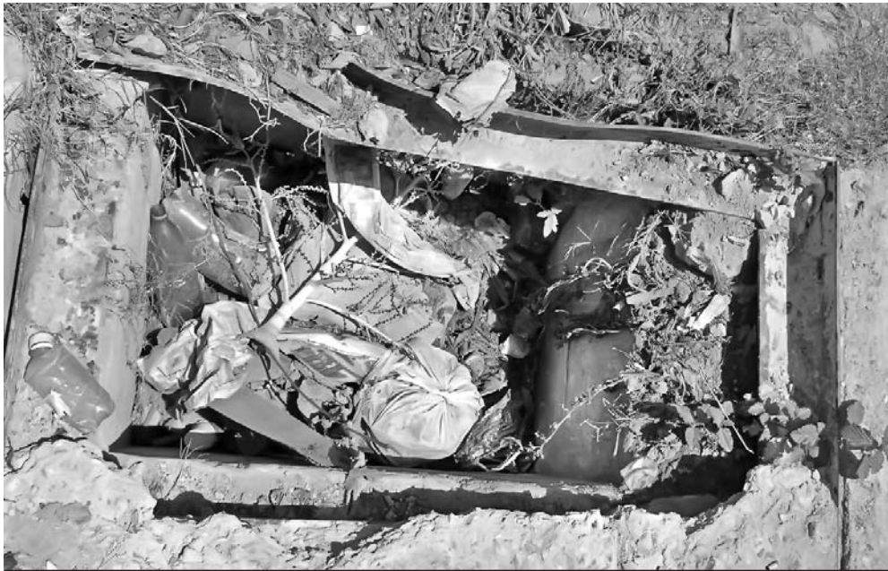
Cada desecho que se encuentre fuera de los tanques recolectores de basura va a parar a las fuentes pluviales y las contaminan.