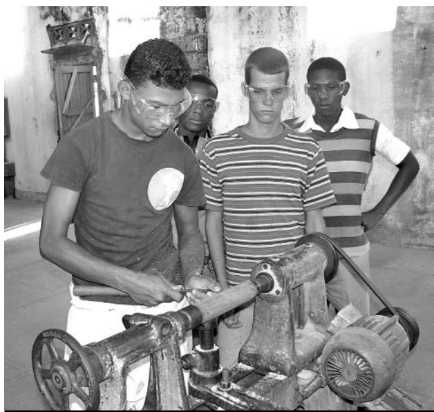
La carpintería será una de las ramas que se estudiará.

CIENFUEGOS.—Un notable ascenso de la masa docente de obreros calificados se registrará a partir de septiembre, cuando en los politécnicos de