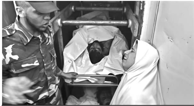
Los ataques aéreos de Israel causaron la muerte a dos palestinos.