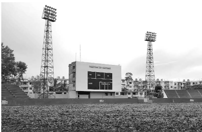
El terreno removido, listo para el relleno y la nivelación.