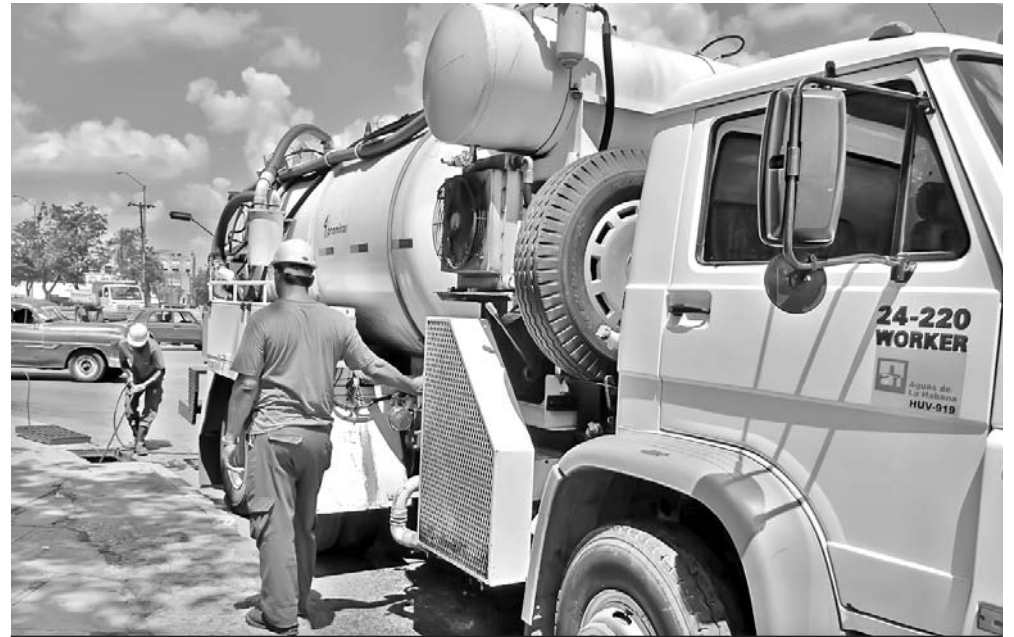
Aguas de La Habana cuenta con diez brigadas que atienden de forma permanente un área determinada y tienen que responder por la calidad del saneamiento de las alcantarillas y los registros.