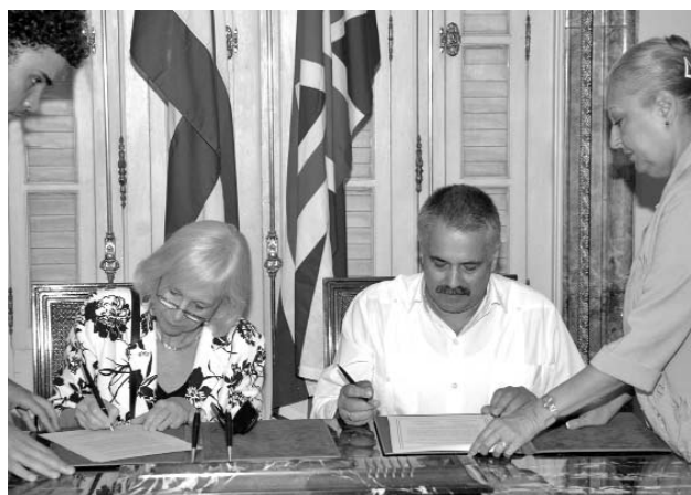
El documento permitirá a ambos países avanzar en temas como el cambio climático.

Destacó, además, el trabajo realizado en nuestro país a partir del debate y la aprobación en el VI