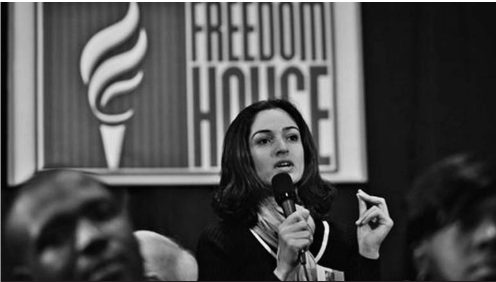
La ultraderechista Freedom House prefirió devolver 1,7 millones de dólares para no responder por la corrupción y el derroche de los fondos.

Otros nueve millones de dólares están destinados a apoyar a los “grupos de veci-