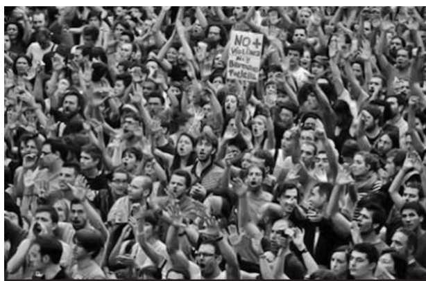
Los manifestantes permanecieron sentados en el suelo rodeados por los agentes.

Los inconformes cuestionan las medidas de austeridad adicionales que pretende implementar el Gobierno para poder recibir el auxilio de los organismos internacionales. A la vez,