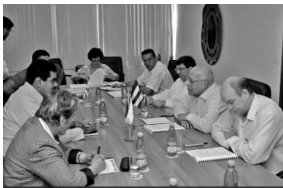
Una de las Mesas de Trabajo, encabezadas por el Canciller Nicolás Maduro y Ricardo Cabrisas, Vicepresidente del Consejo de Ministros.

También en los encuentros, los ministros de ambas naciones revisaron los proyectos de los convenios de la Unión