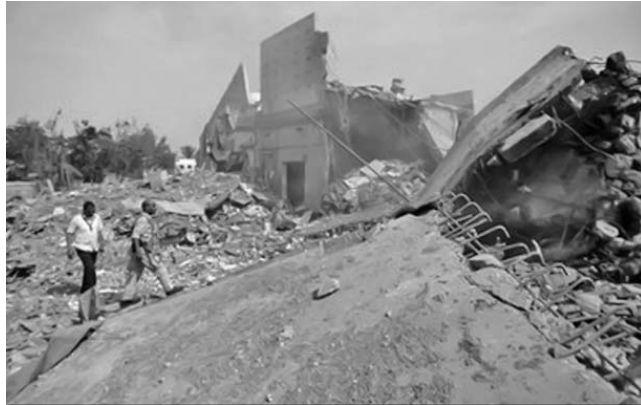
La alianza atlántica reconoció públicamente que esta ha sido la semana de ataques más violentos.

También el portavoz militar de la operación Protector Unificado bajo mando de la OTAN en Libia, el comandante británico Mike Bracken, confirmó que esta semana las fuerzas aliadas llevaron la campaña de ataques "más intensos" contra centros de mando y control del Gobierno en Trípoli y las inmediaciones de la capital, y recaló que los ataques continuarán, según