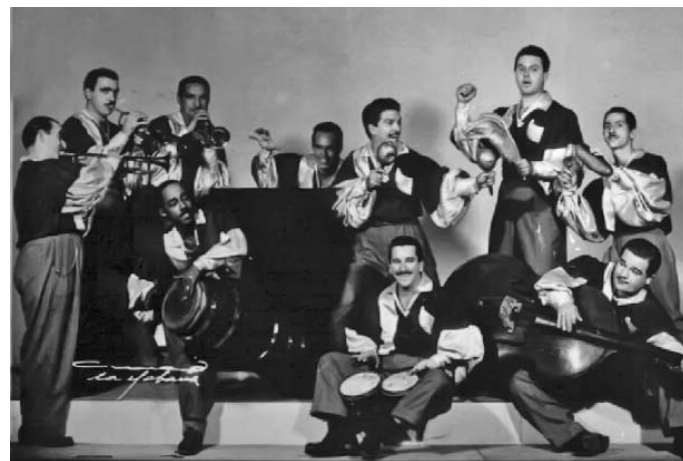
La música del Conjunto Casino merece ser difundida entre los jóvenes.