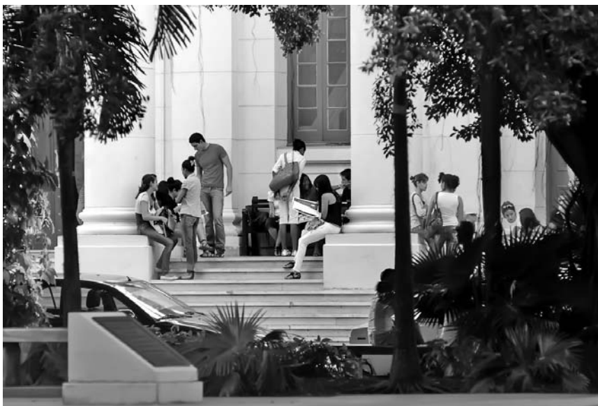
El Seminario llamó a incrementar la calidad de la enseñanza superior y a fortalecer la labor educativa desde la instrucción en todos los tipos de cursos y escenarios docentes.