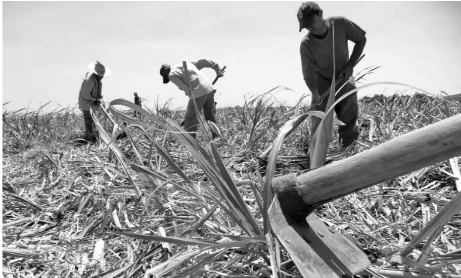
La sistematicidad y calidad de las atenciones culturales están entre las causas del constante rendimiento de las áreas de caña.

“Nos apoyamos en las 30 yuntas de bueyes que tenemos.