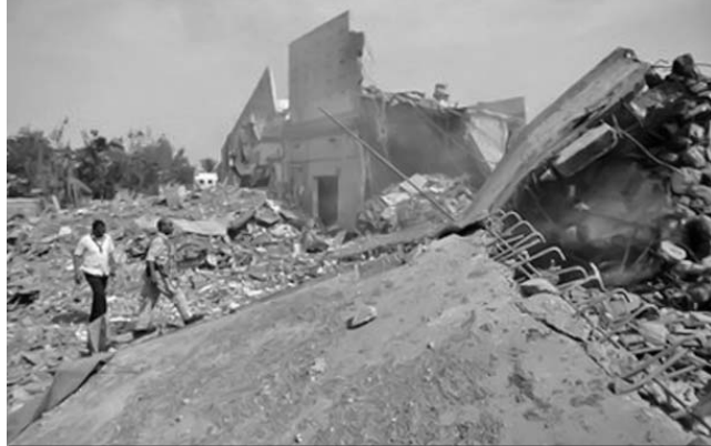
La alianza atlántica reconoció públicamente que esta ha sido la semana de ataques más violentos.

También el portavoz militar de la operación Protector Unificado bajo mando de la OTAN en Libia, el comandante británico Mike Bracken, confirmó que esta semana las fuerzas aliadas llevaron la campaña de ataques "más intensos" contra centros de mando y control del Gobierno en Trípoli y las inmediaciones de la capital, y recaló que los ataques continuarán, según