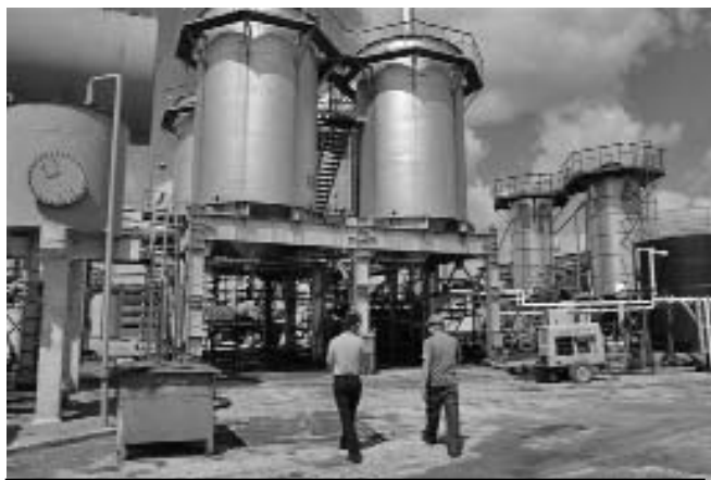
La Sergio Soto trabaja con los crudos de Cárdenas, Pina y Jatibonico.

La Sergio Soto es la única planta del país que se dedica exclusivamente al procesamiento del petróleo cubano