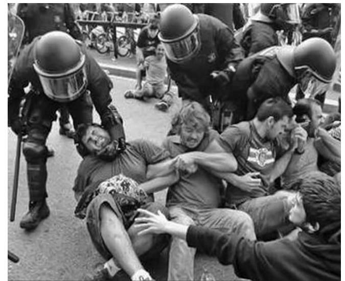
Los agentes arremetieron a golpes contra los manifestantes y les lanzaron pelotas de goma y gas pimienta.

MADRID, 27 de mayo.—Al menos 121 personas resultaron heridas cuando fuerzas antimotines desalojaron violentamente a los manifestantes que ocupaban la Plaza de Cataluña de Barcelona, informó Reuters.