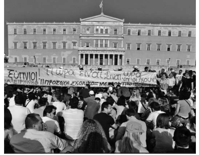
Los manifestantes acampan frente al Parlamento.

unos días. No nos iremos de aquí antes de que haya un referéndum", aseguró uno de los acampados.