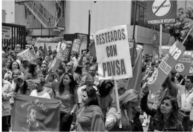
En diversos territorios del país continuaron las manifestaciones de condena a las medidas contra PDVSA.

El vicepresidente ejecutivo consideró las sanciones norteamericanas, por las relaciones de Caracas con Teherán, como un estímulo para fortalecer el proceso de cambios iniciado en 1999, con la llegada de Hugo Chávez al Palacio de Miraflores.