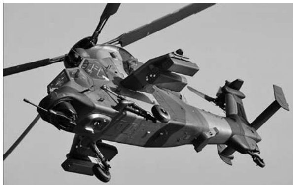
El Reino Unido autorizó el uso de Apache contra Libia, con el pretexto de que habrá menos víctimas civiles.

Mientras, Moscú criticó cualquier posibilidad que incluya el reforzamiento de efectivos militares de Estados Unidos en países del antiguo Pacto de Varsovia. La veintena de aviones, según ha indicado la parte polaca, estaría en el país del Este europeo a partir del 2013. (EFE)