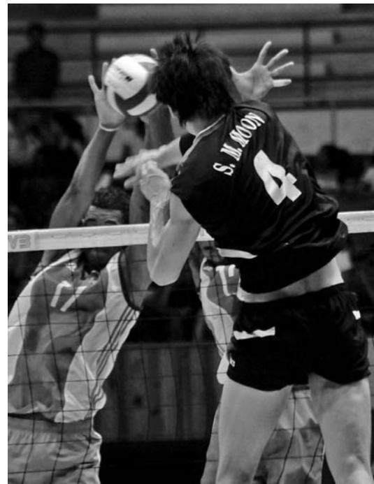
El bloqueo será fundamental contra Sudcorea.

Será imprescindible atacar a los locales con el servicio, en tanto el recibo, con los auxiliares Wilfredo León, Bell y el líbero Keibel Gutiérrez ha de trabajar tranquilo si quiere derrotar a una