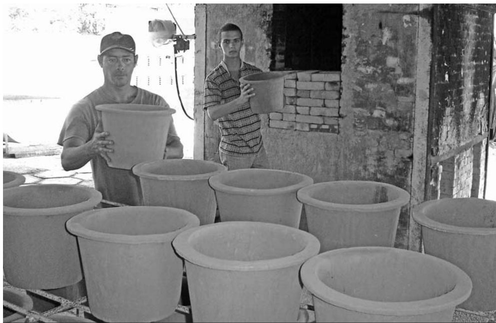
Ya los filtros están logrados; queda ahora conformar el reservorio definitivo.