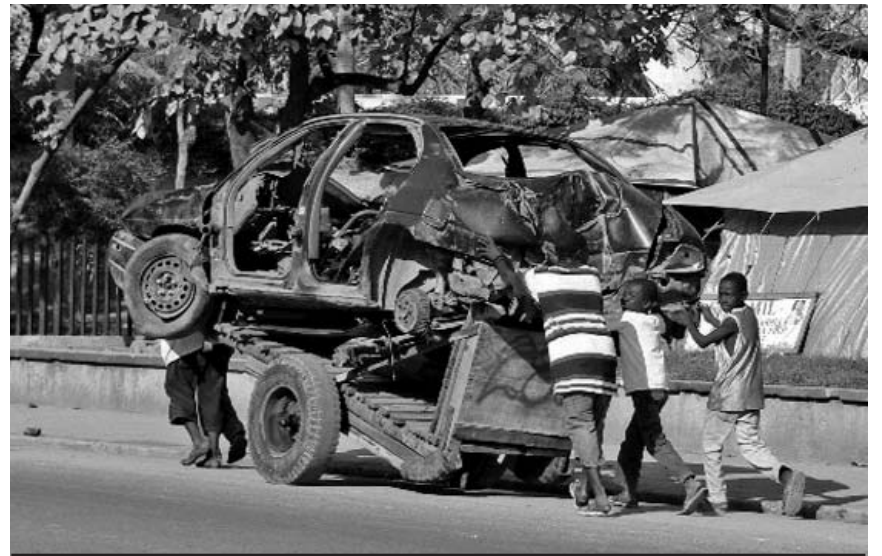
La población masculina haitiana sufre de un alto índice de hernia inguinal debido a la realización de enormes esfuerzos físicos desde tempranas edades y en la adultez.