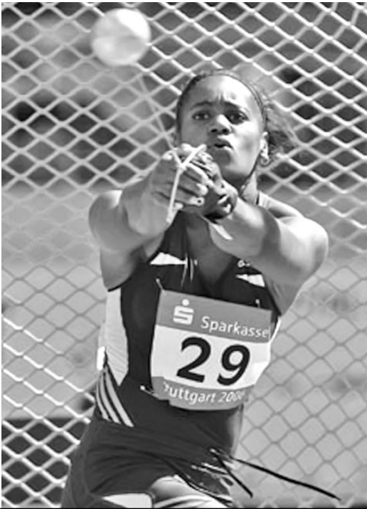
Yipsi reinó en Brasil y Bolt reapareció dorado en Roma.