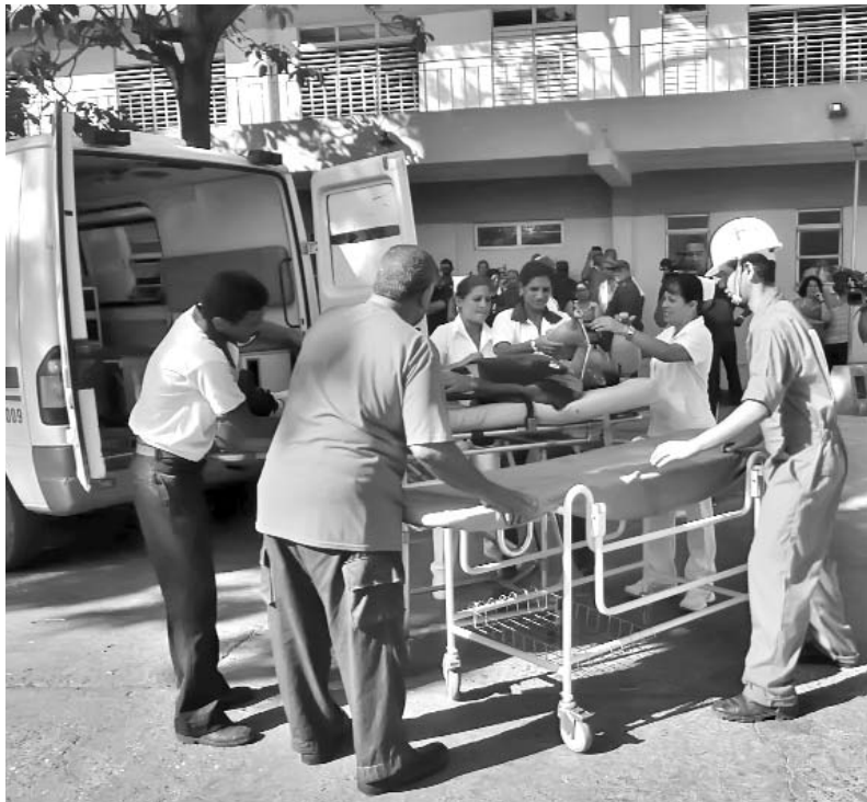
La atención a lesionados formó parte del Ejercicio.

En Holguín, el Consejo de Defensa Provincial puntualizó en áreas del trasvase Este-Oeste los resultados del proceso de