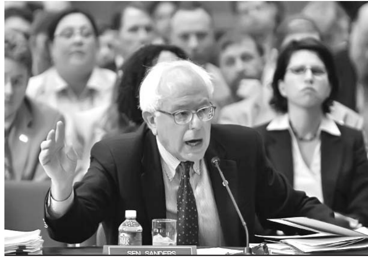
El senador Sanders hizo pública una relación de los mayores violadores del pago de impuestos en Estados Unidos.