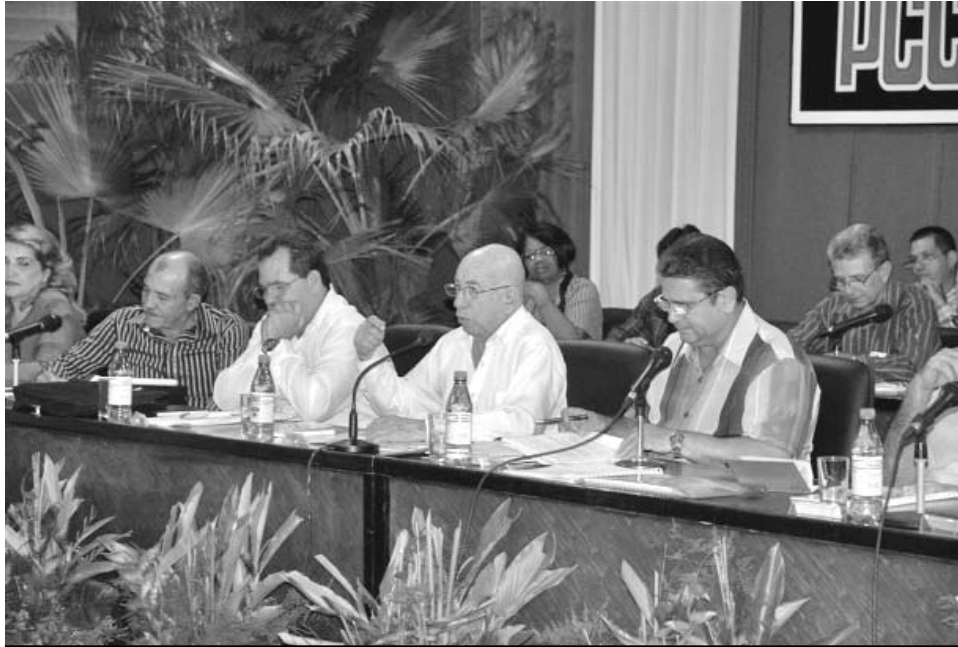
El Partido tiene que ser fuerte, exigir, controlar con la forma y los métodos adecuados, dijo Machado Ventura.

“El contrato hay que cumplirlo y exigir de ambas partes”, insistió Machado Ventura,