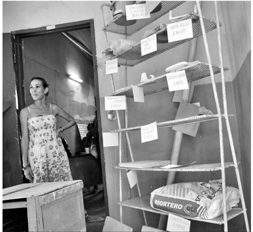
En cada establecimiento debe existir un lugar visible con la lista oficial de precios de los materiales que se ofertan, o al menos una muestra de ellos con su correspondiente precio.

Una situación parecida apreciamos en un punto de venta del municipio del Cerro, provincia de La Habana, donde