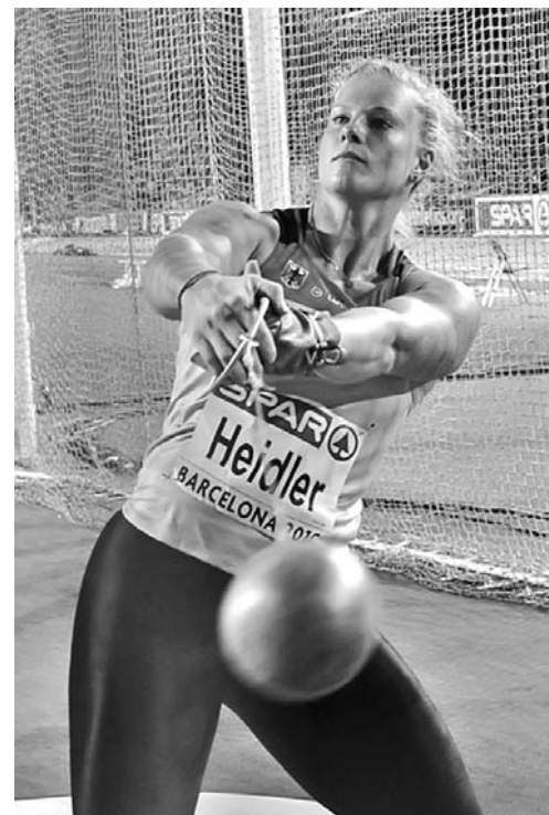
La alemana Heidler superó en más de un metro la primacía anterior.