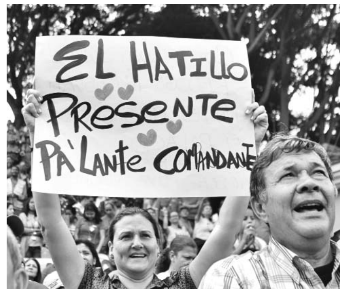
Los venezolanos corearon consignas como “Pa’lante mi Comandante”, y “Chávez estamos contigo”.

Ashton reconoció que la nueva misión apoyará a los opositores a construir instituciones inexistentes e impulsar un proceso político con la instauración de un sistema de partidos que consiga el derrocamiento de Gaddafi, a la vez que apoyarán las operaciones militares que lleva a cabo la OTAN.