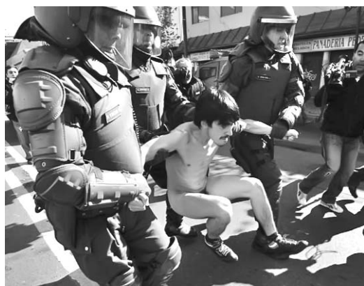
Los carabineros apresaron a decenas de personas.

Con el 94,11 % de los votos escrutados, el PP logró un 37,58 % de los votos frente al 27,82 % de los sufragios conseguidos por los socialistas, que en las anteriores elecciones del 2007 habían tenido un 34,92 % de los votos, según AFP.