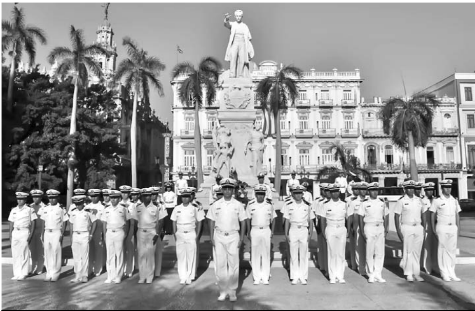
Jefes y tripulantes del BE-01 Cuauhtémoc rindieron homenaje a José Martí.

Ministerio de Comercio Interior 3 de mayo de 2011