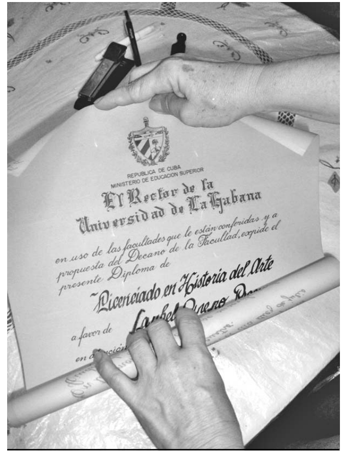
Muchas personas tienen que recorrer ahora grandes distancias para un trámite que antes se resolvía en la misma provincia.