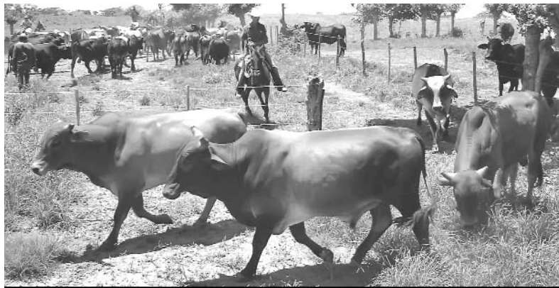
El conteo sistemático de los animales favorece el adecuado control de la masa vacuna.

La mortalidad vacuna, a modo de ejemplo, constituye hoy el talón de Aquiles de la ganadería camagüeyana, con varias empresas por encima de los índices medianamente permisibles, situación nada favorable para la gestión económica del sector en la provincia, que perdió el año pasado, solo por ese concepto, más de 16 millones de pesos.