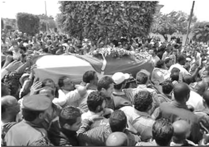
En el multitudinario funeral, el pueblo mostró su indignación por los ataques contra inocentes.

de la ciudad, hemos contado hasta 12 misiles que impactaron en tierra”, declaró un portavoz insurgente a Reuters.