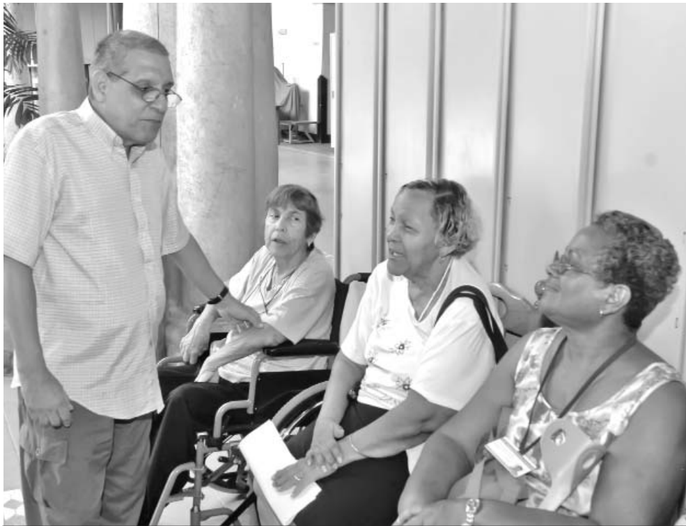
La atención y el buen trato son fundamentales.