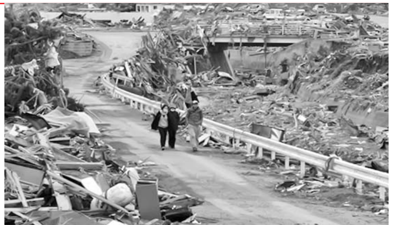
El presupuesto aprobado por el Gobierno japonés prevé acelerar la reconstrucción de viviendas e instalaciones vitales.

Este primer presupuesto de emergencia no necesitará de un nuevo endeudamiento del país, pero un segundo está ya en