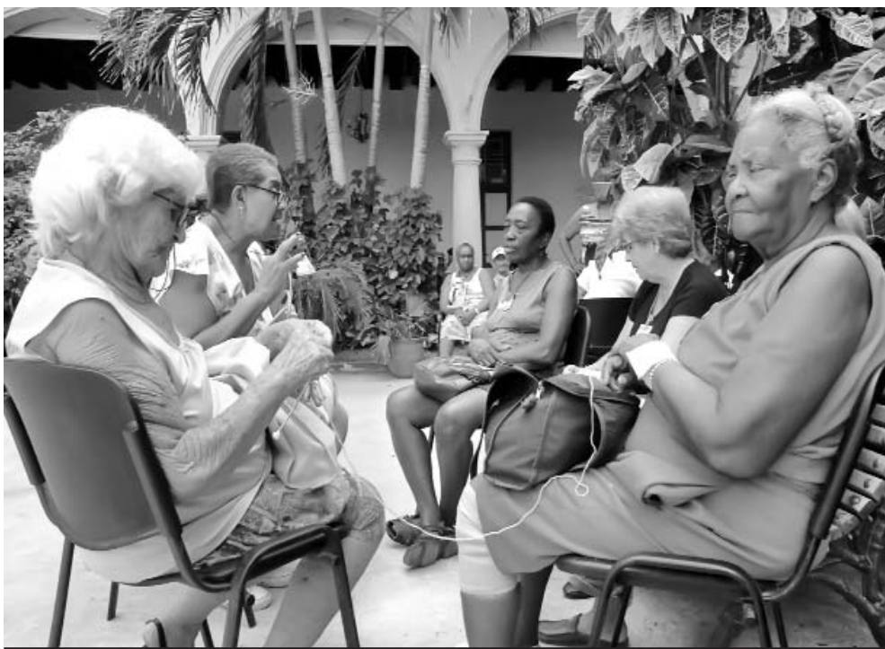
Con actividades diseñadas para ellos, ocupan su tiempo en la institución.

ras de la mañana, las charlas sobre temas de salud, hasta los diferentes talleres de la tarde. Todo cuenta y es bien recibido por los actores fundamentales de este proyecto: los ancianos.