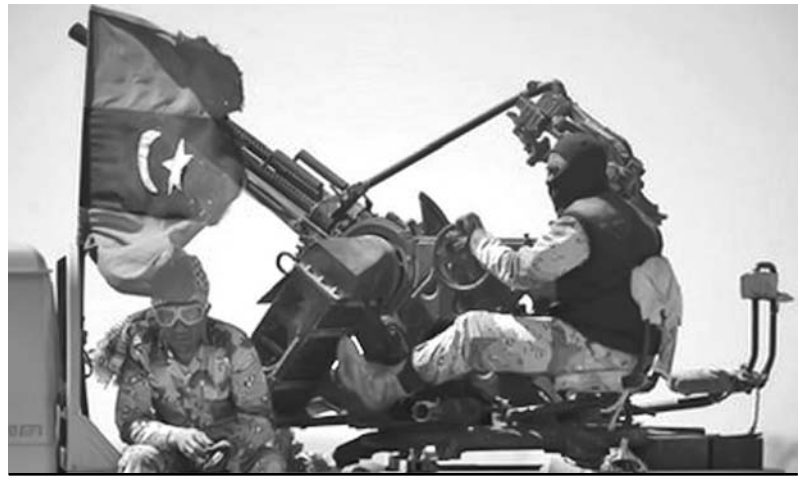
Los insurgentes controlan la mayor parte de esa ciudad, la tercera villa del país.

Estados Unidos expresó su completa confianza en la OTAN para llevar a cabo la misión en Libia. "Tenemos absoluta confianza en la capacidad de la OTAN para llevar a bien la tarea de reforzar el embargo de armas, así como la zona de restricción aérea y la protección de los civiles en