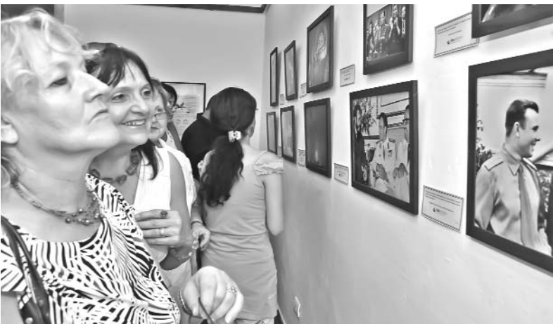
La exposición fotográfica Vámonos, 50 años del primer vuelo del hombre al espacio , en conmemoración a la llegada al cosmos del soviético Yuri Gagarin, quedó inaugurada este martes en el Museo de Historia Natural. Las imágenes fueron facilitadas por la agencia rusa Ria Novosti, y muestran varios momentos de la vida profesional del cosmonauta así como de la interacción de este con varios líderes de la Revolución cubana. Se encontraban presentes el excelentísimo señor Mikhail L. Kamynin, embajador de la Federación Rusa en la República de Cuba, y Oleg Viazmitinov, representante de la agencia Ria Novosti en nuestro país.