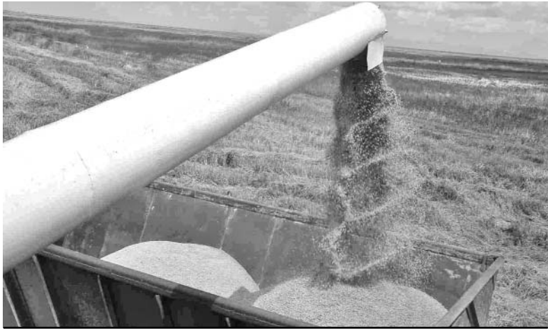
Sur del Jíbaro debe iniciar la cosecha a finales del presente mes.