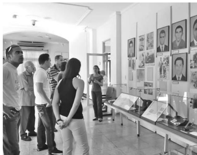
Cada sala muestra a los visitantes, como eterno homenaje, las fotos de los combatientes que ofrendaron sus vidas en el cumplimiento del deber.