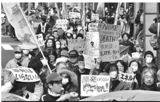
Manifestantes expresan su rechazo a la energía nuclear.

Tras haber anunciado en un primer momento que esa cifra era “10 millones de veces más elevada” que la normal, TEPCO convocó a una conferencia de prensa urgente para admitir que se había equivocado, al confundir los elementos radiactivos analizados. En cambio, confirmó el nivel de “1 000 milisieverts por hora”.