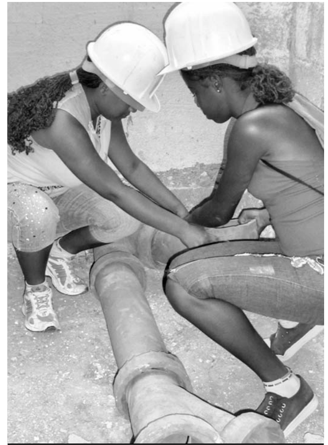
El apoyo a obras en construcción también lleva el cuño de las muchachas.

lería, estas últimas trabajadas de manera cooperada con otro Politécnico, el Diosmedes Córdoba.