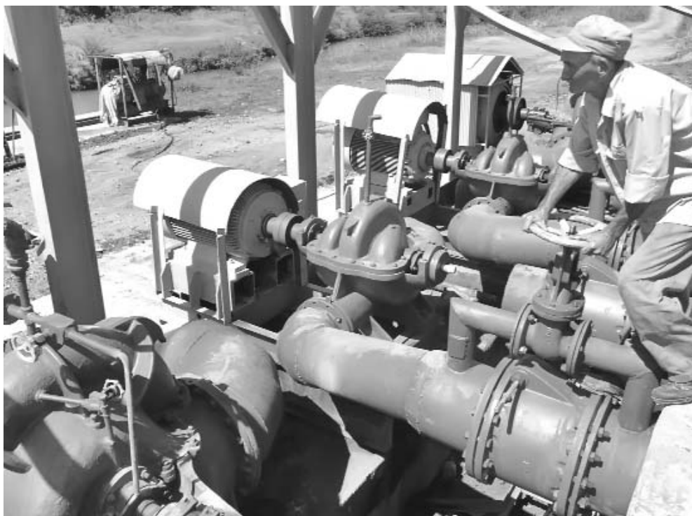
A la estación de Veinte Rosas solo le falta el techo, indispensable para la protección de los equipos instalados.

“Por ese motivo, y de acuerdo con un programa aprobado por el Ministerio del Azúcar (MINAZ), las bombas sumergibles que se deterioraron por los años de explotación fueron sustituidas por cuatro del tipo horizontal, movidas por motores eléctricos y con potencia suficiente para conducir el agua hasta una elevación de 30 metros, donde se encuentra el depósito de descarga.