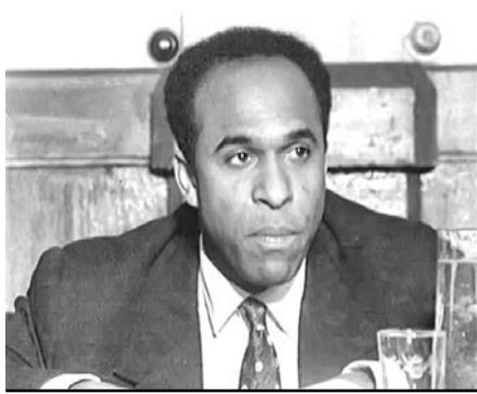
Frantz Fanon (1925 - 1961).

Ambos alentaron a los nuevos lecto- res a desentrañar las claves del pensa-