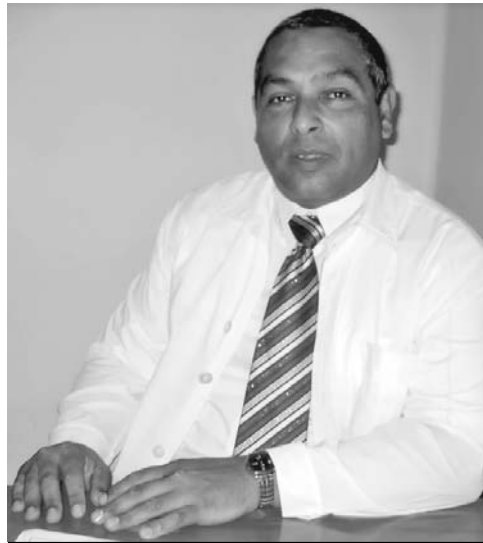
Profesor Manuel Delgado González.

—Sí. De ahí la importancia de que las mujeres en edad fértil que deseen un embarazo acudan a la Consulta Preconcepcional en su área de salud, donde la pareja tiene la posibilidad de recibir orientación respecto al momento ideal de la concepción, y conocer también los procedimientos para la modificación o eliminación de factores de riesgo y hábitos dañinos que pudieran