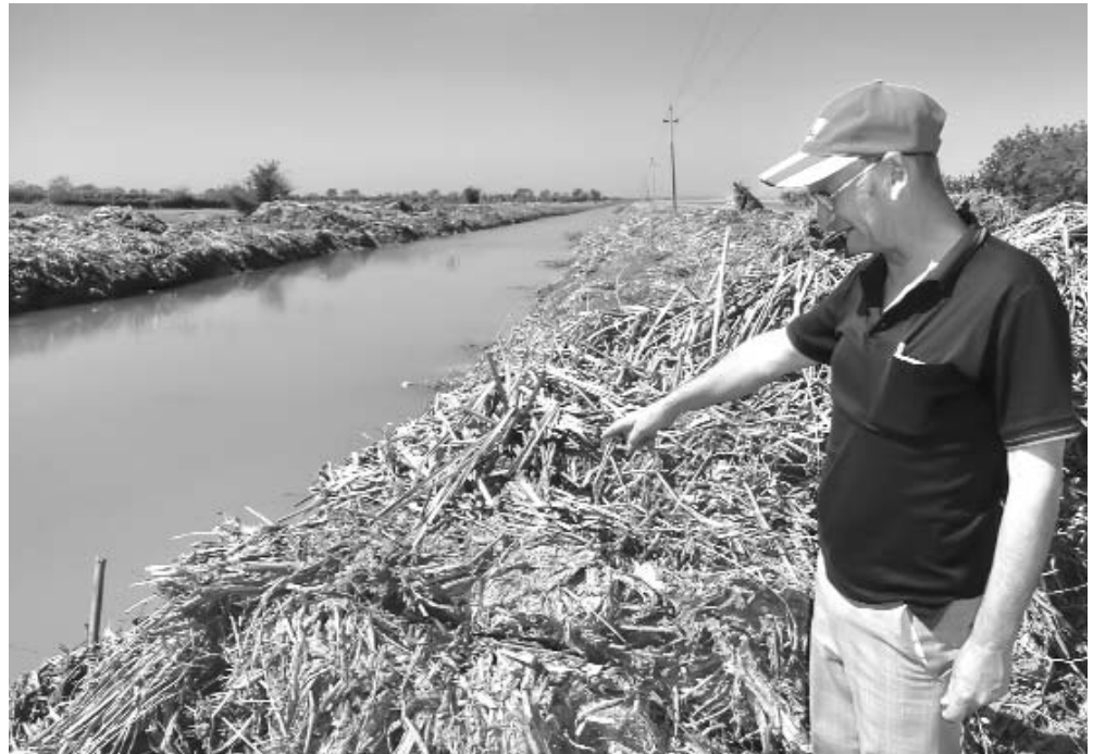
De los canales se han extraído decenas de toneladas de plantas acuáticas, las cuales obstaculizaban el flujo de agua.