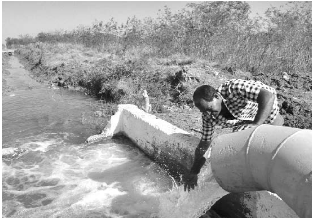
En Cristino Naranjo también se recuperaron 20 kilómetros de canales secundarios y más de 100 obras de fábrica.