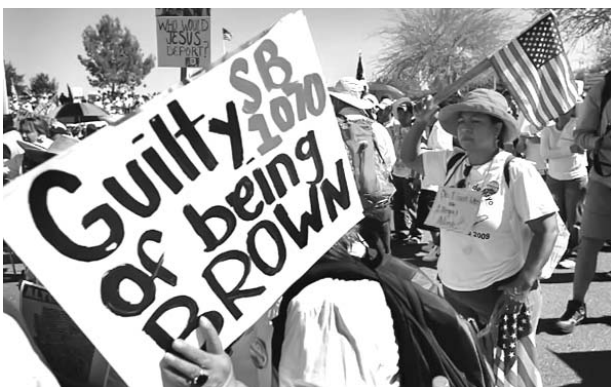
Más de una docena de estados en el país analizan implementar leyes similares a la SB1070, la primera en criminalizar la presencia de indocumentados en Estados Unidos.

Uno de los textos, el SB1611, pretendía negar a una familia vivir en casas subsidiadas por el estado si todos sus miembros no comprobaban su estatus migratorio, indicó el rotativo californiano.