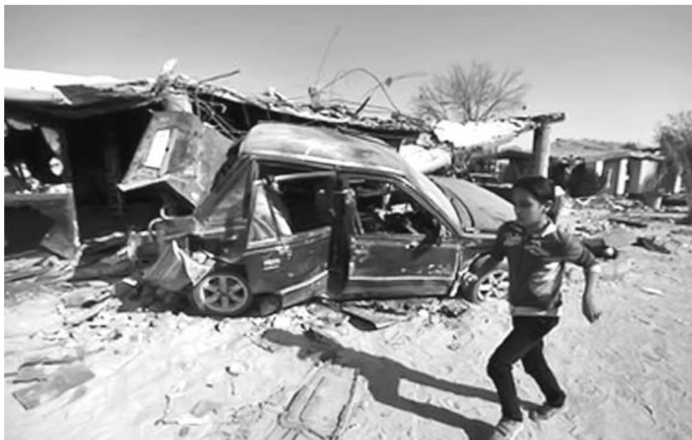
Una niña libia corre tras los bombardeos.

con el General de Ejército Raúl Castro Ruz, Presidente de los Consejos de Estado y de Ministros. Como parte de su programa de actividades también sostendrá encuentros con otros dirigentes cubanos.