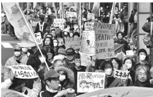
Manifestantes expresan su rechazo a la energía nuclear.

Tras haber anunciado en un primer momento que esa cifra era “10 millones de veces más elevada” que la normal, TEPCO convocó a una conferencia de prensa urgente para admitir que se había equivocado, al confundir los elementos radiactivos analizados. En cambio, confirmó el nivel de “1 000 milisieverts por hora”.