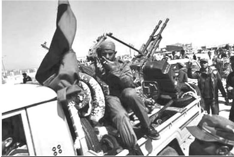
La ofensiva rebelde ha recorrido 441 kilómetros desde Bengasi en tan solo 48 horas, gracias a los bombardeos aliados.

Ibrahim atribuyó los éxitos militares de los insurrectos a los “intensos bombardeos durante horas y horas, sin parar” de los aliados contra las fuerzas leales a Gaddafi a lo largo de 400 kilómetros de carretera costera entre Ajdabiya y Sirte. Asimismo, llamó a poner fin a la muerte de civiles a causa de los