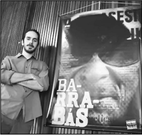
Salvatore representa una nueva voz en el cine venezolano.

Los tres primeros galardones del Festival correspondieron, por ese orden, a La batalla de los invisibles , del mexicano Manuel de Alba; Viviendo otra mirada , del brasileño Guillermo Planel, y Embarrancados , del