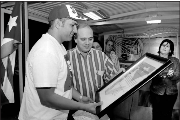
Roberto Morales Ojeda, ministro de Salud Pública, entregó al doctor Lázaro Gustavo Roque un reconocimiento especial para la Brigada por su combate contra la epidemia del cólera.

ron por el aeropuerto internacional José Martí, Roberto Morales Ojeda, ministro de Salud Pública, encomió la profesionalidad de estos médicos y les entregó diplomas de reconocimiento por su incondicional ayuda a la nación caribeña.