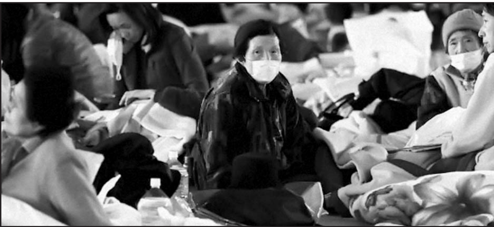
Además de la emergencia nuclear, los miles de japoneses evacuados deben enfrentarse al desabastecimiento de la comida.

Por otro lado, una nueva réplica de 6,3 grados en la escala de Richter hizo temblar la zona nororiental. Desde el viernes, se registraron casi 300 réplicas del devastador seísmo, y la Agencia Meteorológica local indicó anoche que hay un 70 % de posibilidades de que se produzcan réplicas de hasta siete gra-