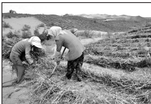
Ante la crisis alimentaria, la igualdad de género en la agricultura incrementaría la producción.

De acuerdo con la FAO, en el 2010 unos 925 millones de personas estaban desnutridas, de los cuales 906 millones residían en países en vías de desarrollo.