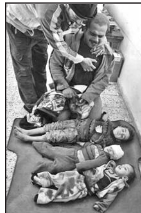
La ocupación ha dejado miles de víctimas civiles.

En las últimas semanas, las fuerzas internacionales han recibido fuertes críticas por haber causado muertes de civiles en varios sucesos distintos.