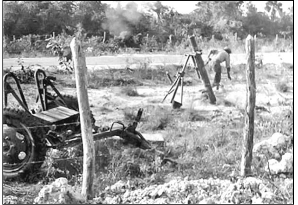
El Batallón 117 fue bombardeado con napalm por los mercenarios.

Al grito de avión, comencé a buscar donde parapetarme pues no teníamos ningún atrincheramiento y no había accidentes del terreno para ello, visualicé un tubo de alcantarilla y cuando me acerqué, estaba totalmente ocupado por la gente que se habían metido unos encima de los otros en un diámetro de medio metro, me tiré detrás de una piedra, no más grande que mi cabeza, en mi tonta suposición que estaba protegido, por suerte no me hirieron, pero por poco un cohete de napalm me achicharra, pues percibí un fenómeno de colores vivos que, formando una marea ígnea, se aproximaba a mí y a unos