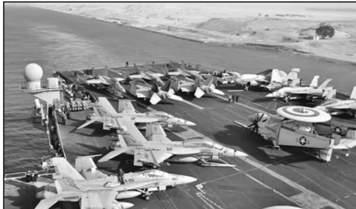
El portaviones USS Enterprise lleva a bordo miles de marines.

ragua, María Rubiales, criticó la existencia de una arremetida mediática contra Libia, con noticias contradictorias, infladas y utilizadas al antojo de los centros de poder de las grandes potencias para justificar una intervención militar extranjera que abrirá las puertas a quienes quieren apoderarse de los recursos petroleros libios.