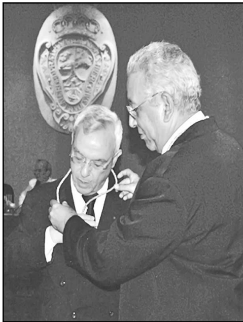
Eduardo Torres Cuevas entrega la Medalla Académico de Número a Eusebio Leal.

Según sus palabras, el objetivo principal de la renovada institución es convocar, reunir, apoyar y, sobre todo, erigirse en instrumento para que la política cultural y educacional que tiene a la historia como motivación, sea realmente interpretación correcta y sabia, y que parta del ejercicio de saber buscar los orígenes y, a la vez, respetar la evolución del pensamiento en el tiempo.