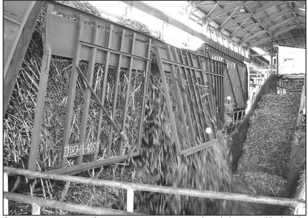
Cuatro empresas unen esfuerzos y recursos para garantizar el abasto estable de caña.