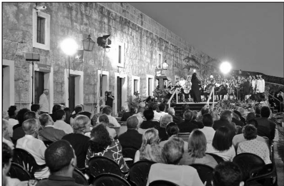
En la Plaza de San Ambrosio, de la Fortaleza de La Cabaña, tuvo lugar el acto oficial de inauguración de la XX Feria Internacional del Libro.

6:30 Buenos días 8:30 Mujeres de nadie 9:15 Viaje al centro de la Tierra 10:00 Animados 10:30 Había una vez 11:00 Telecine infantil: Aventuras en la Isla del Tesoro 12:30 Circo carpa Trompoloco 1:00 Animados 1:30 Teleclases 4:00 Telecentros 6:00 NND 6:30 Felicity 7:00 Hola juventud 7:27 Para saber mañana 7:30 El joven Hércules 8:00 Antesala. Béisbol: Gtmo. vs.