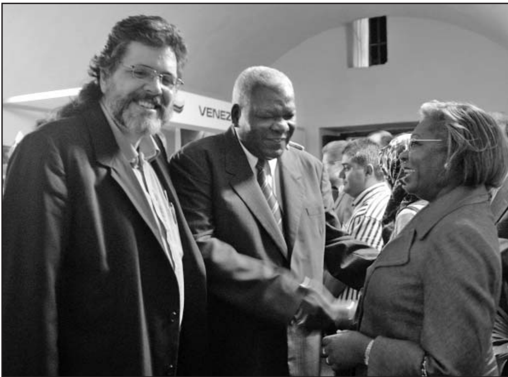
Lazo y Abel departen con la Ministra de Cultura angolana, Rosa Cruz e Silva.

Recorren ministros de Cultura de ocho países y escritores laureados las salas dedicadas al Bicentenario de la primera independencia americana y a las expresiones artísticas y literarias de los pueblos de la región