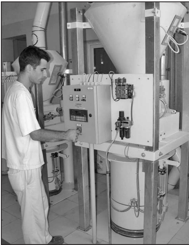
La nueva tecnología aumentó la capacidad, la eficiencia y humanizó la labor del molinero.

Aunque los resultados productivos y económicos hacen que aflore el orgullo del molinero, es común escuchar entre los 420 tra-