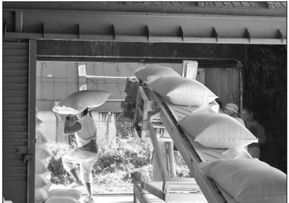
Un problema resuelto hoy es la extracción sistemática de la harina ensacada con la seguridad del transporte ferroviario y por camiones.

resaltar el compromiso de sus 132 aniristas que, contra viento y marea, han mantenido funcionando la planta. “Esa misma inspiración la tendremos ahora que el país nos exige mayor esfuerzo para levantar la economía”, aseguró.