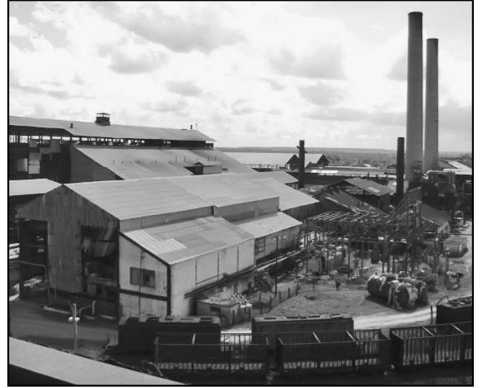
¿Podrá el Guiteras salir del bache e incorporarse al grupo de los seis más integrales formado por el Melanio Hernández, Batalla de las Guásimas, 14 de Julio, Antonio Sánchez, Uruguay y el 30 de Noviembre?

A partir de las deficiencias del 2009 se elaboró un programa para “atacar” las áreas responsables de un elevado tiempo perdido. No pocas fueron las medidas técnicas y organizativas aplicadas en un colectivo de experiencia, acostumbrado a marchar siempre en la vanguardia. Pese a todo, la industria es responsable del 33 % del