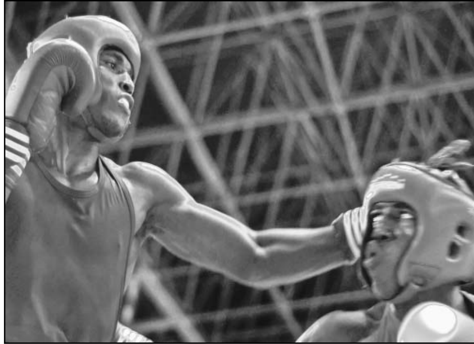
En Hungría, el camagüeyano La Cruz (81 kg) tendrá dos rivales de consideración como el uzbeko Elshod Rasulov y el ruso Nikita Ivanov.