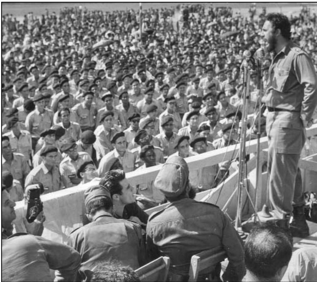
Fidel le habla a los Responsables de Milicias.

Los camiones que nos transportaban comenzaron el avance por la estrecha carretera, todos mirábamos hacia el cielo en busca de aviones enemigos y atentos hacia las posibles emboscadas de los paracaidistas. A la altura del kilómetro ocho, alguien gritó ¡Avión! y todos nos lanzamos de los camiones buscando protección en la cuneta de la carretera. Un B-26 nos ametralló. Al retirarse fuimos hacia los camiones, algunos choferes habían desaparecido con el susto y finalmente continuamos el avance. De nuevo volvió la aviación enemiga, nos dispersamos a ambos lados de la carretera y se decidió conti-