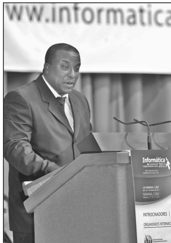
Medardo Díaz Toledo, ministro de Informática y las Comunicaciones, inauguró la XIV Convención y Feria Internacional Informática 2011.