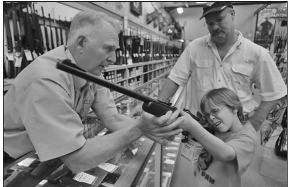
Cualquier mayor de edad y residente en Estados Unidos puede comprar un arma sin que ni siquiera se comprueben sus antecedentes penales.

La exgobernadora de Alaska, Sarah Palin, instó a sus simpatizantes a mantenerse firmes sobre su derecho a poseer armas, recogido en la Segunda Enmienda de la Constitución de EE.UU., ante los rumores de un posible cambio en las leyes que regulan su control.