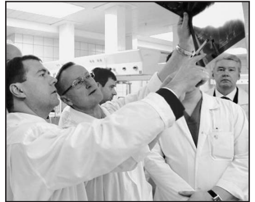
El mandatario ruso visitó a los heridos en el Instituto Sklifosovski, de Moscú.

Gerardo Hernández es un Héroe de la República de Cuba, y el Gobierno de Cuba hará todo para salvarlo, enfatizó el Presidente del Parlamento, quien afirmó que el terrorismo impune, escandalosamente mostrado a la luz del día, no puede ocultarse siempre, y afirmó su convicción de que algún día, no lejano, la verdad saltará a la luz pública. (AIN)