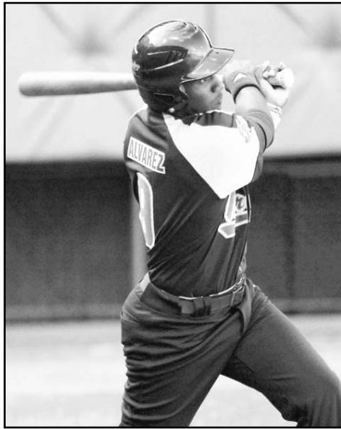
A Pedroso le restan 43 vuelacercas para llegar a los 300.

orientaron, sobre todo a los de la ESPA Nacional, fundamentales en mi tránsito de los juveniles a la primera categoría.”