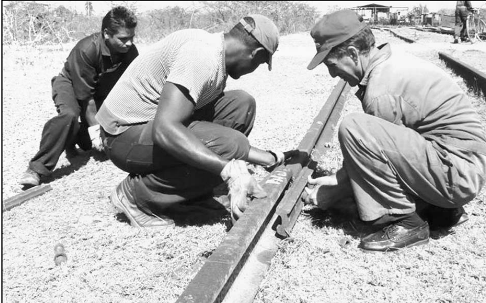
Poner a punto la línea, labor de mucho rigor.