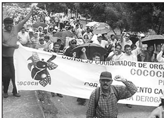
Los productores consideraron la medida anti-constitucional y antihondureña.

El texto legal, promovido por Zelaya, y aprobado en mayo del 2008 por el Congreso