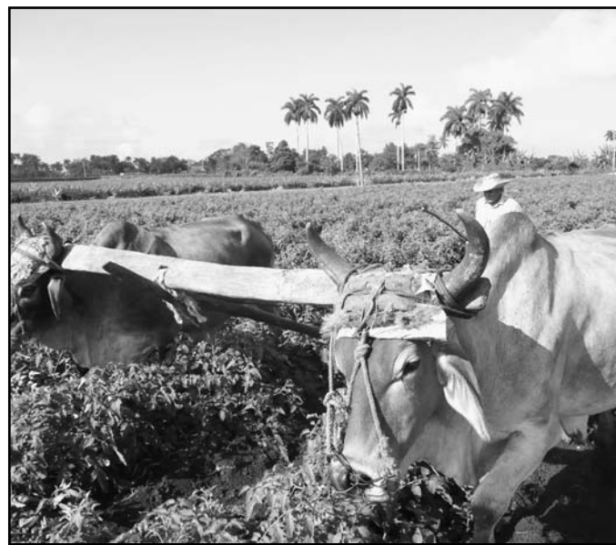
El empleo de bueyes, alternativa obligada en las atenciones culturales al cultivo.