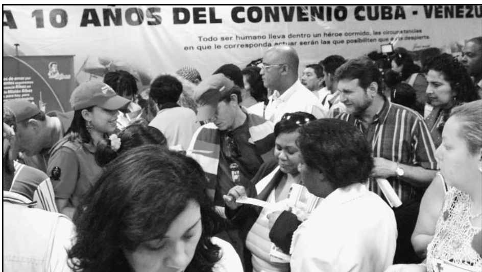
Los Gobiernos de Cuba y Venezuela han liderado con éxito esta década de intercambio bilateral en el ámbito educativo.