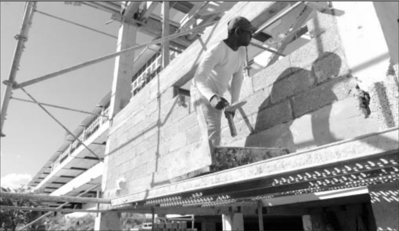
Transformaciones en los espacios interiores y exteriores tienen lugar en el antiguo IPUEC Raquel Pérez.

Propósito muy importante es estudiar la situación actual de la adquisición y circulación de los medios materiales de uso común y proponer las soluciones más adecuadas para reorganizar el sistema con el fin de hacerlo más racional y económico.