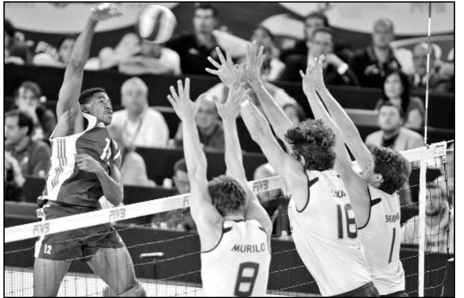
El voli cubano, femenino y masculino, tendrá en Brasil a su principal rival en pos de las medallas.

LA HABANA. —Las féminas de la halterofilia cubana subirán, por vez primera, a la plataforma de los Juegos Nacionales Escolares, en julio del 2011, según el calendario oficial de la Federación Nacional de este deporte. Por otro lado, lo más significativo internacionalmente para los pesistas del patio serán los Juegos Panamericanos de Guadalajara, en octubre, y el Campeonato Mundial de París en noviembre, segundo clasificatorio para los Juegos Olímpicos de Londres'12 después del de Antalya 2010. (AIN)