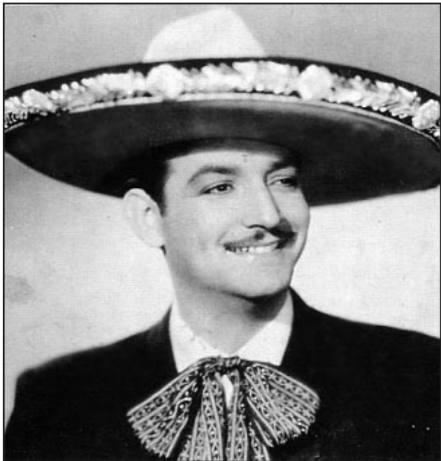
Jorge Negrete, ídolo de multitudes.