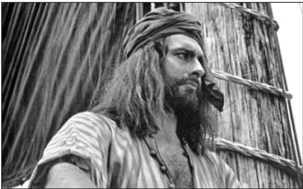
De la imaginación de Salgari surgió Sandokan, llevado varias veces al cine.