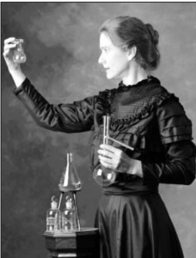
María Curie fue por segunda vez Premio Nobel.