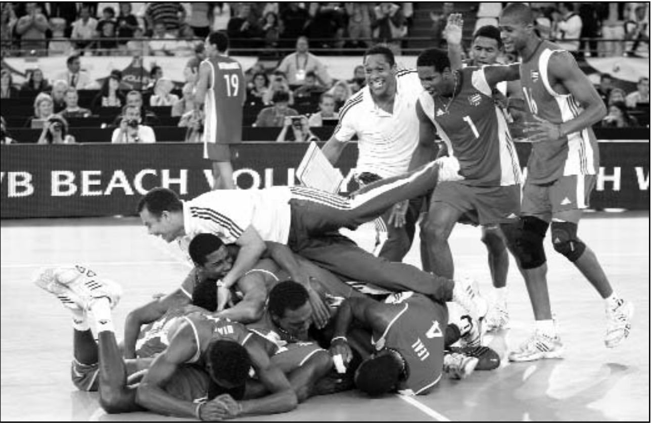
El voli (m) tuvo una fructífera temporada.