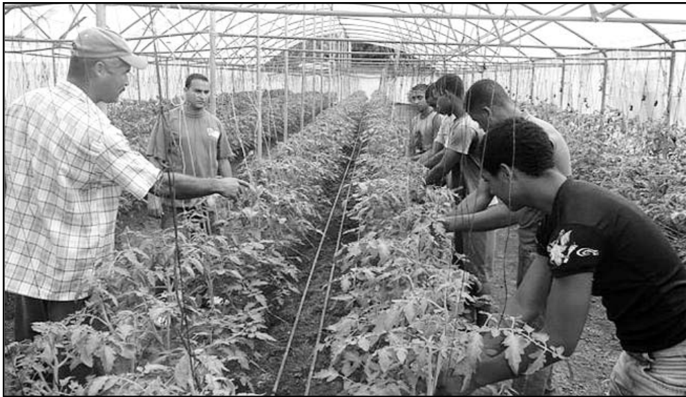
Los jóvenes se preparan para trabajar a pie de surco. Su aporte será decisivo para obtener aquí las 60 000 toneladas de productos agrícolas que demanda la provincia de otros territorios.