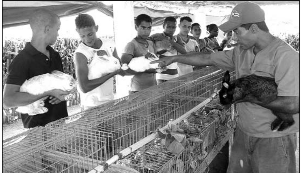
Los planes de estudio hacen hincapié en la formación integral de los futuros profesionales.