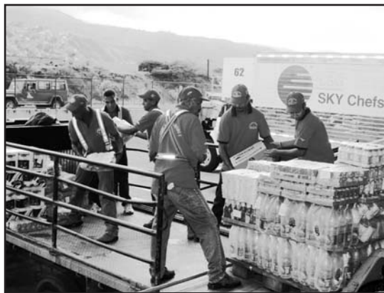
Los importantes aportes de la solidaridad internacional llegan a las familias en los refugios.

De acuerdo con el ministro de Agricultura y Tierras, Juan Carlos Loyo, funcionarios y