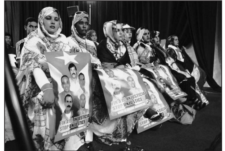
Las luchadoras saharauíes también apoyaron la causa de los Cinco.

Finalmente, la hija de Ramón propuso a los delegados enviar una carta al presidente norteamericano, Barack Obama, para exigirle la liberación inmediata de "cinco hombres, cinco pa-