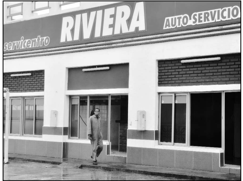
En el Servi-Cupet Riviera, situado en el litoral habanero, desde horas tempranas fueron protegidos los bienes y el personal.

En distintos puntos del litoral habanero se verificó la labor informativa de las autoridades, incluso con el uso de altoparlantes, a fin de prevenir los posibles riesgos del temporal. En otras zonas del litoral norte occidental no se reportaron incidencias de envergadura.