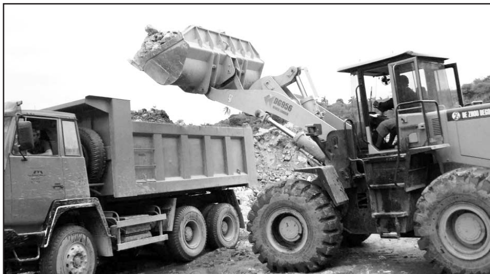
El aporte de las canteras matanceras es indispensable para responder a la demanda de cemento gris del país.

materia prima que hacemos en un mes para estabilizar la fabricación del cemento gris en el país", aseguró luego de reconocer que lo hicieron con la mano de obra justa, aproximadamente con menos de la mitad de los obreros utilizados en épocas en que la fábrica llegó a extraer hasta 100 000 toneladas al año.