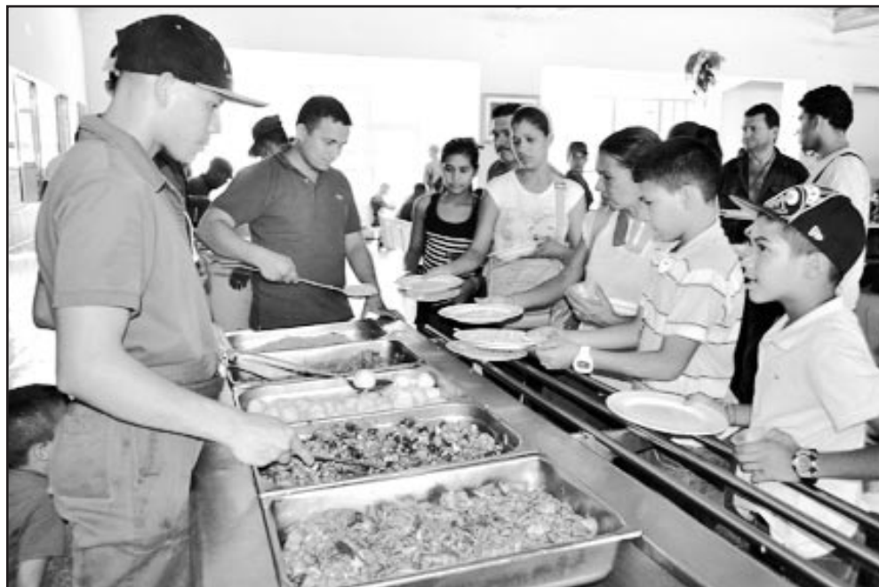
El Gobierno venezolano garantiza a todas las familias los servicios básicos en los refugios.

CARACAS, 13 de diciembre.—Este lunes, el presidente venezolano Hugo Chávez, compartió con un grupo de familias damnificadas alojadas en el Palacio de Miraflores, sede del Gobierno Bolivariano, según YVKE Mundial.