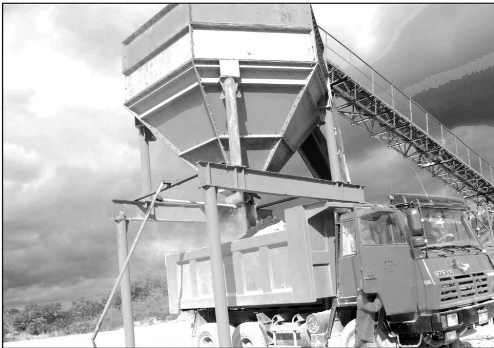
En el yacimiento de Canasí aspiran a cerrar este año con más de 50 000 toneladas de yeso triturado.

Para Pedro Cabrales, jefe del centro, otra importante conquista es la alta productividad. "Se nos pidió duplicar la