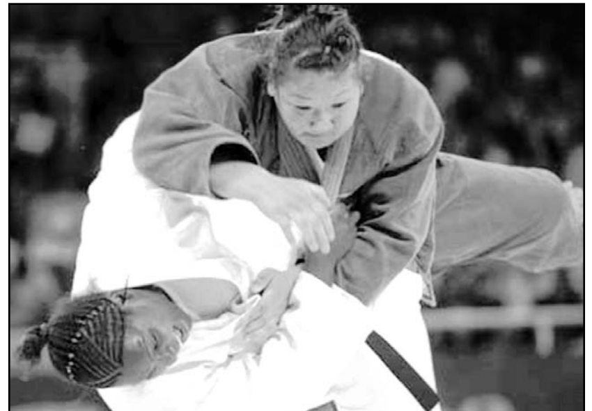
Con su plata, la pinareña dijo presente en otro podio internacional.

Desde el sábado hasta la víspera, el torneo tókota reunió el concurso de 361 judocas (154 féminas y 207 varones) de 53 naciones, incluyendo a cuantiosos medallistas olímpicos y mundiales invitados por los organizadores.