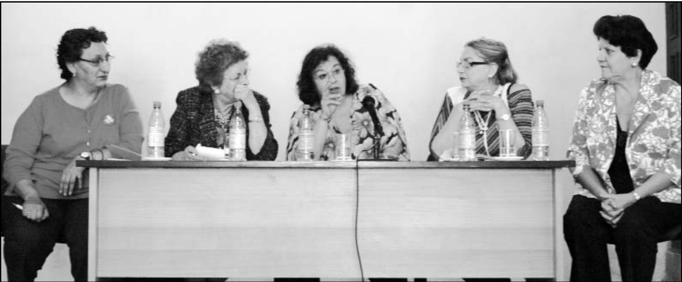
La celebración del aniversario de la Federación Democrática Internacional de Mujeres, también constituyó un homenaje a Vilma.

Dirigentes históricas del movimiento de mujeres en América Latina ratificaron esta semana su decisión de continuar la lucha por la paz y la justicia social con motivo de la celebración del aniversario 65 de la Federación Democrática Internacional de Mujeres (FDIM) que tuvo lugar en La Habana.