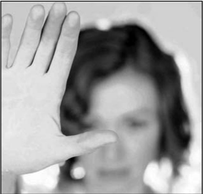
A las víctimas les corresponde identificar, revelar y denunciar cualquier manifestación violenta.