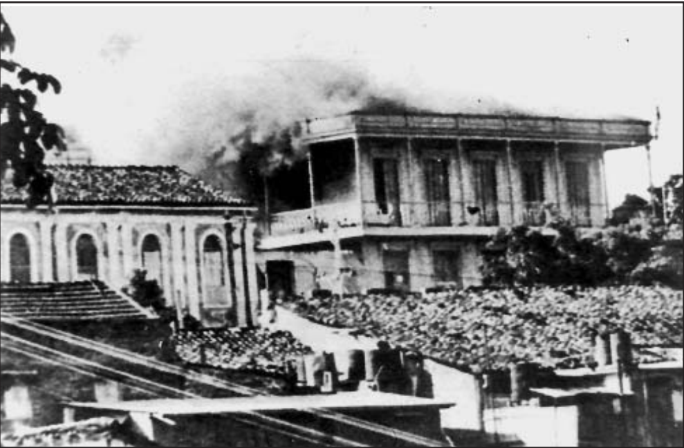
La Estación de Policía en Santiago de Cuba fue atacada e incendiada por los revolucionarios.