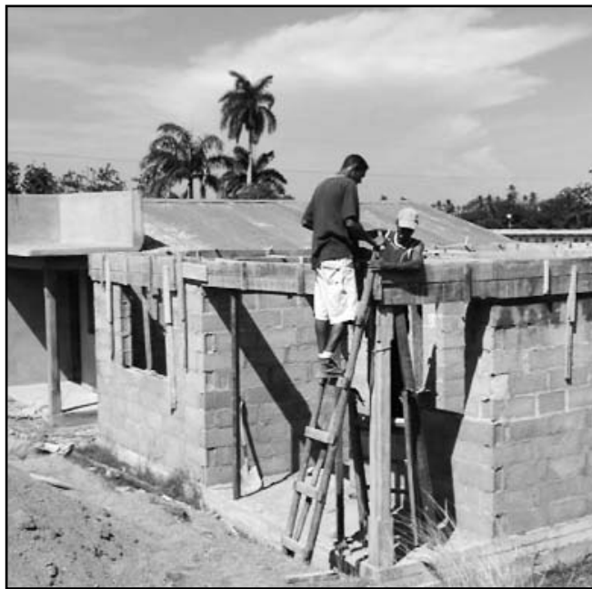
El SIME interviene en la fabricación de 76 renglones, destinados al programa de la vivienda.

No obstante, más allá de la eficacia de los mecanismos de distribución y comercialización, tal empeño solo se materializará con un fuerte crecimiento productivo. En ese sentido, y hacia el redimensionamiento industrial de pequeñas entidades que intervienen en estos proyectos, debe enrumbar el SIME sus nuevos propósitos.