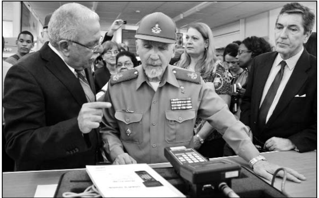
El Vicepresidente de los Consejos de Estado y de Ministros recibió una información detallada sobre el laboratorio y la asistencia científico técnica que brindará a las telecomunicaciones de la Mayor de las Antillas.

—La bradicardia es un tipo de arritmia opuesta a la taquicardia, que cursa con frecuencias elevadas. Tanto la bradicardia como la taquicardia pueden manifestarse en un mismo paciente.