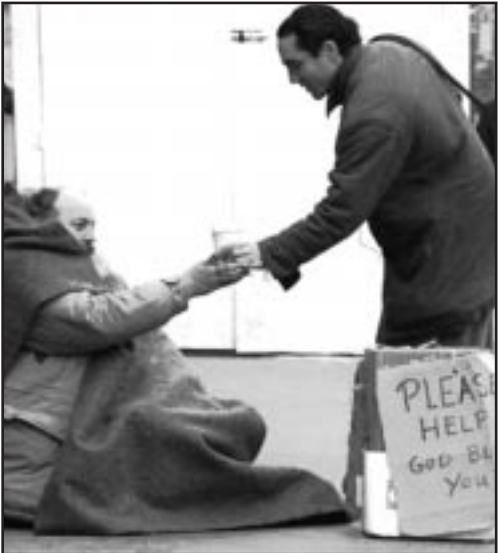
Las diferencias entre ricos y pobres en Estados Unidos cada vez son mayores.

situación actual por la que atraviesa la sociedad norteamericana, expuesta a altos índices de pobreza, cuya tasa ocupa el tercer lugar en este aspecto entre las peores naciones desarrolladas, de acuerdo con un informe de la Organización para la Cooperación y Desarrollo Económicos. El número de estadounidenses que viven en la pobreza se dispara, pero también los millones de los millonarios. Tal realidad es la esencia del capitalismo salvaje: hacer cada día más ricos a los ricos y a los pobres más desvalidos. (Leandro Maceo Leyva)