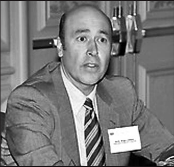
Hugo Llorens, embajador de EE.UU. en Honduras, sabía que era ilegal e inconstitucional el derrocamiento del Presidente Manuel Zelaya.

“Cualquier miembro del Congreso que debatió la propuesta también debería ser separado de oficio, y el candidato presidencial del Partido Nacional, Pepe Lobo, que hizo suya la idea, debe ser inhabilitado para ejercer cargos públicos por 10 años”, añade. ■ LLORENS, REICH, ROS-LEHTINEN Y COMPAÑÍA En su informe, Llorens se refugia detrás de los expertos legales hondureños que la embajada consultó, con el fin de entender los argumentos esgrimidos por los partidarios del golpe y sus opositores. Lo cierto es que muchos otros documentos, no “confidenciales” como este, sino “ Top Secret ”, han sido intercambiados entre Washington y su embajada en Honduras durante los eventos del 2009. Las relaciones muy estrechas de Hugo Llorens con lobos de la política exterior estadounidense, explican sin dudas mucho mejor que su informe “confidencial” el giro pro-golpista que rápidamente tomó la diplomacia de Obama y Hillary Clinton. La congresista ultraderechista cubano-americana Ileana Ros-Lehtinen, que representa al Partido Republicano en