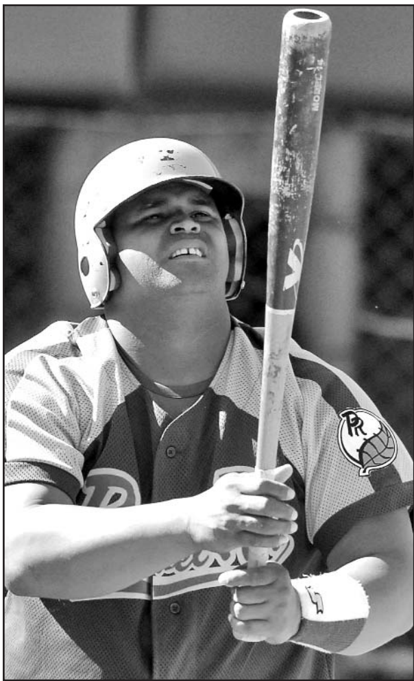
En el bate de Peraza estarán buena parte de las victorias pinareñas.