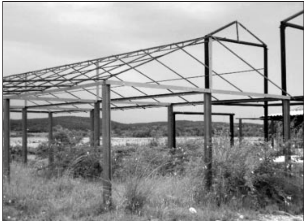
Utilizaron tantos hierros, que uno se pregunta qué hubiera sucedido si una tormenta eléctrica afectaba la zona.

encargado de precisar la procedencia de buena parte de las traviesas y carriles, provenientes, en su mayoría, de los ramales hacia los Centros de Acopio de las empresas "Quintín Banderas", de Corralillo; "Panchito Gómez Toro", de Quemado de Güines; "26 de Julio", de Santo Domingo; 10 de Octubre, de Ranchuelo; José Smith Comas, de Cárdenas y de la Cooperativa "Marcelo Salado", de La Habana.