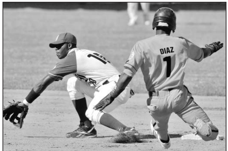
Los naranjas buscarán dominar otra vez el Oriente poniendo la velocidad en función de la ofensiva.

Camagüey es un equipo renovado cuya aspiración debe ser mejorar la actuación de la pasada edición, al igual que los holguineros de Héctor Hernández. Así andan las cosas por el oriente. Mis favoritos: Villa Clara y Santiago.