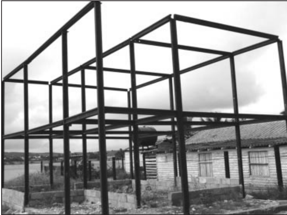
La mayor parte de los raíles utilizados conservan su utilidad. Su valor aproximado es de 900 000 dólares.