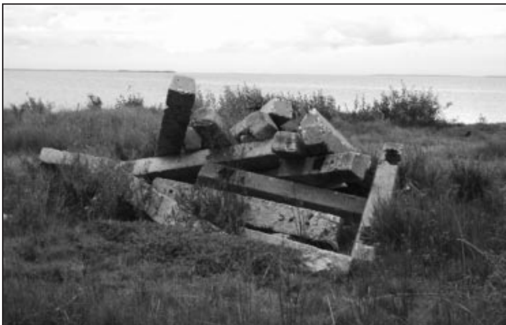
Las traviesas se utilizaban para la cimentación.

Por qué no se tuvieron en cuenta a tiempo las alertas realizadas por la Presidenta del Consejo Popular, quien de manera reiterada expresó su preocupación por lo que ocurría en La Panchita,