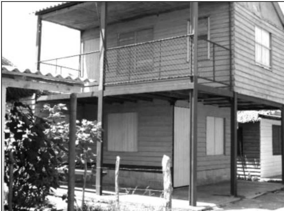
Mientras el país libra una guerra sin cuartel contra el robo de rieles y de angulares, en La Panchita eran empleados en la construcción de viviendas de verano.

Como han reconocido autoridades del Gobierno en el municipio, de la Dirección de la Vivienda y de Planificación Física, además de otros funcionarios entrevistados, solo el descontrol y la falta de responsabilidad puede explicar la ocurrencia de tales hechos.