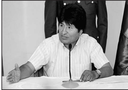
Evo Morales, en conferencia de prensa en la residencia de San Jorge.

En esa ocasión, Morales responsabilizó a Estados Unidos con los últimos intentos de golpe de Estado en Hon-