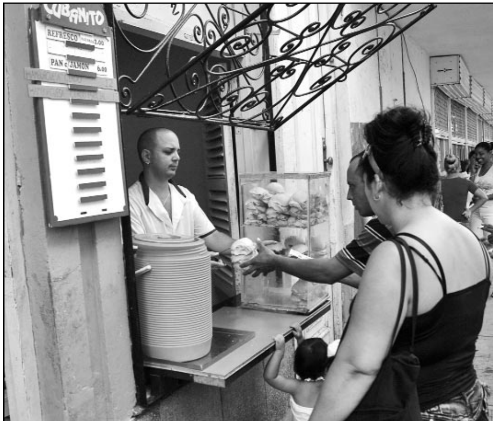
El país asegurará, en la medida de lo posible, la materia prima y suministros para el ejercicio del trabajo por cuenta propia.

Resulta oportuno señalar que estos suministros no aparecerán por arte de magia. El fortalecimiento de la oferta se sustenta en la reorientación de las importacio-