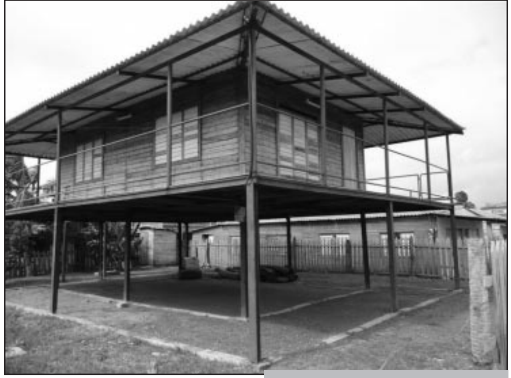
Algunos techos empleados corresponden a los entregados para quienes resultaron damnificados por los huracanes.

Así, por ejemplo, en el artículo No 9 quedaba plasmado que los pilarotes o lingotes podían ser rieles o raíles de línea, jata u otra madera. Refugiados en ese y otros artículos comenzó el desorden, y los raíles que debía tener de 70 a 80 centímetros, según lo establecido, alcanzaron cinco, siete y hasta más de 10 metros en horcones, columnas, portales, cercas y otros fines.