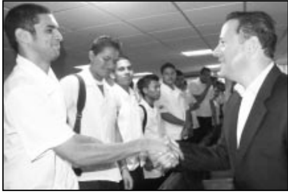
El Vicepresidente de Panamá, saludó a los futuros médicos que se forman en la ELAM.

“Creo que la formación que se está dando aquí es muy de vocación, no