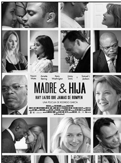
Madre e hija, de Rodrigo García, abrió el IV Festival del Cine Global Dominicano.

Momento significativo de la gala inaugural