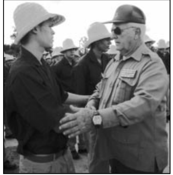
“Es esencial cumplir el plan diario de proyección”, destacó el general de división Manuel Pérez Fernández.

Ángela Soto Montenegro, viceministra del Transporte, informó que los jóvenes trabajan en la vía central, ramales y subramaes ferroviarios, en