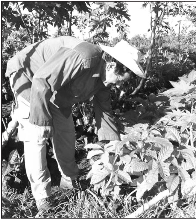
Las posturas para el fomento del café en el llano están garantizadas.