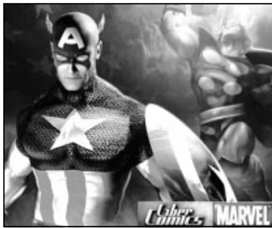
Capitán América, del comic a la película que ya se rueda.