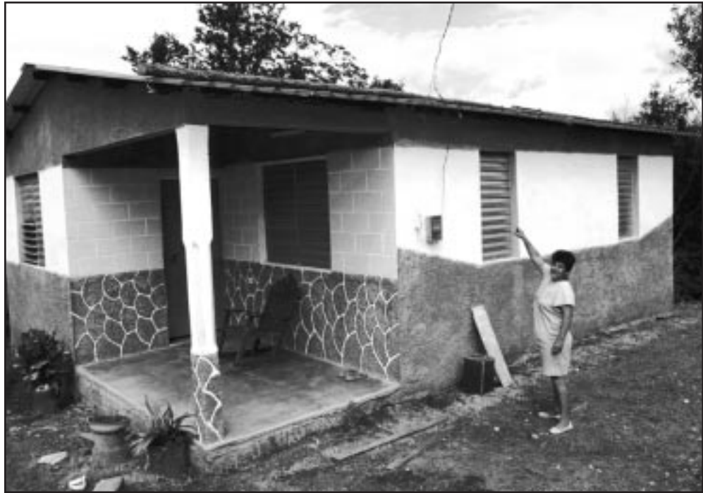
En Viñales, los bloques dintel se han empleado en un número significativo de obras.

Siguiendo el mismo principio, los especialistas aseguran que mediante bloques dintel es posible fundir la zapata de una casa, y con los diseñados para las esquinas del cerramiento, con forma de L, también se pueden hacer las columnas