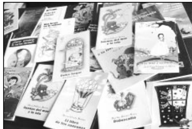
Cada libro que ve la luz constituye una experiencia nueva para el colectivo de Ácana.

Así, Ácana arriba a su vigésimo aniversario y al décimo del sistema de ediciones territoriales con alrededor de 400