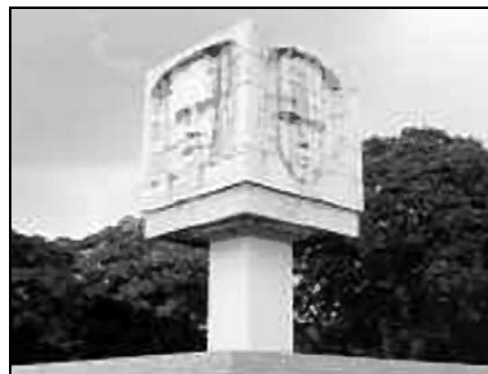
Monumento a Abel Santamaría, de René Valdés.

Durante un mes, hasta el 15 de diciembre próximo, el evento, que lleva el nombre del destacado creador René Valdés Cedeño (La Habana, 1906 - Santiago de Cuba, 1976), impulsará la talla de mármol y el modelado de metales. Valdés contribuyó a la formación de varias generaciones de escultores como