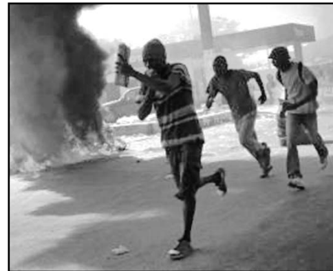
Haitianos protestan en la capital.

“La MINUSTAH vuelca excrementos en la calle”, se podía leer en una pancarta, en