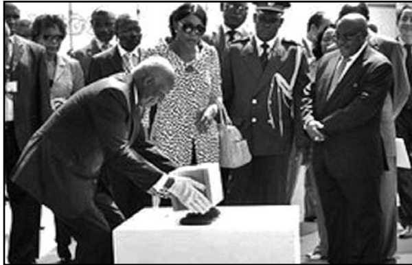
El Presidente de Angola colocó la primera piedra para la construcción de la biblioteca virtual de Luanda.

LUANDA, 11 de noviembre. —La celebración del aniversario 35 de la independencia de Angola tuvo como colofón hoy la realización del acto central conmemorativo, presidido por el mandatario del país, José Eduardo Dos Santos, reportó PL.