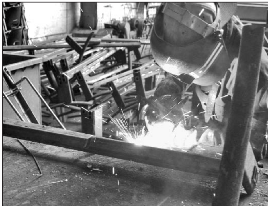
Gracias a la entrega de los obreros, los equipos de soldar continúan trabajando.

No obstante, Cubana de Acero continúa haciendo ajustes de esfuerzo para elevar la productividad y el aprovechamiento de los recursos, porque en este sentido la empresa, y la industria sideromecánica en general, aún tienen muchas reservas por explotar.