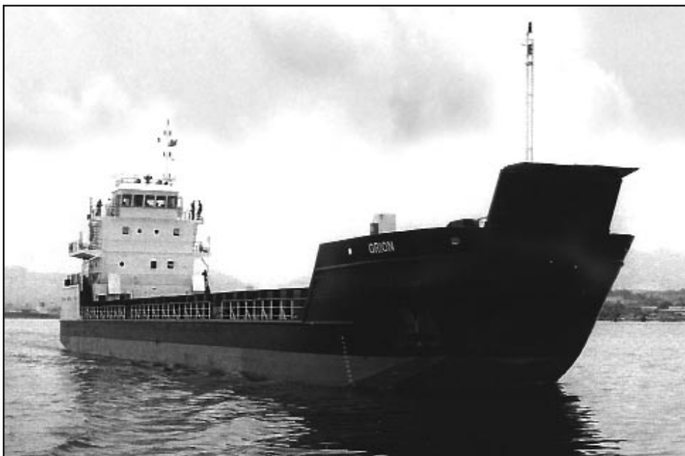
Orión, patana de carga autopropulsada construida en Astilleros DAMEX, en Santiago de Cuba. Una de las embarcaciones que más operaciones de cabotaje realiza en el país.