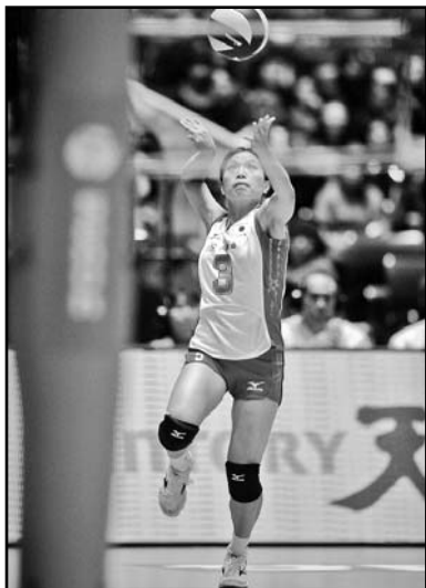
La veterana Yoshie Takeshita, un puntal en la selección nipona.