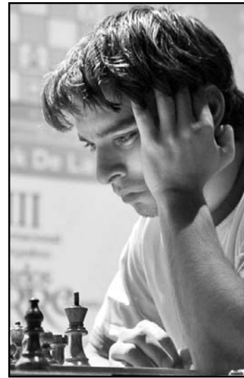
El cubano ha rendido una buena actuación.

La página web del certamen indicó que el antillano consumió 56 lances de una apertura Española y se mantuvo como único invicto