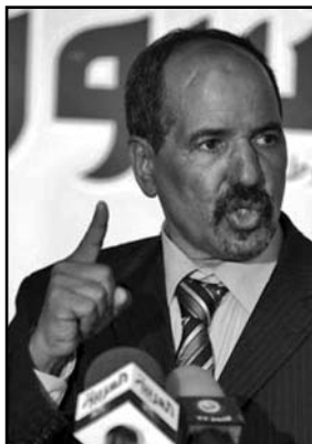
El presidente de la RASD denunció que Rabat pretende descarrilar las negociaciones sobre la autodeterminación.