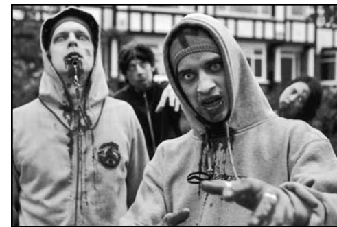
Fotograma de Shaun de los muertos .