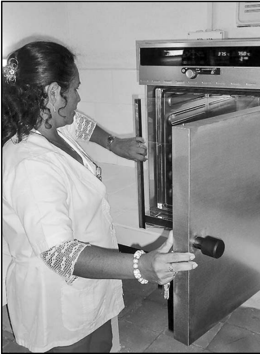
Al extenderse a municipios como Majibacoa, la red del SUMA abrió nuevas posibilidades para todo el país.

Alternativa que no todos conocen para detectar y actuar a tiempo sobre la segunda causa de muerte por cáncer en el hombre