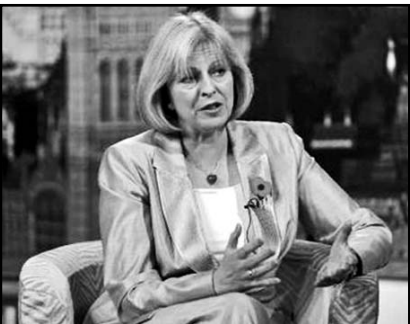
La Ministra de Interior británica anunció medidas drásticas sobre la inmigración de trabajadores y estudiantes.

Por su parte, la organización Sortir du nucléaire recordó que no existe lugar para estos desechos ni en Francia ni tampoco en Alemania, porque el sitio adonde se llevan no tiene las condiciones necesarias para acogerlos.