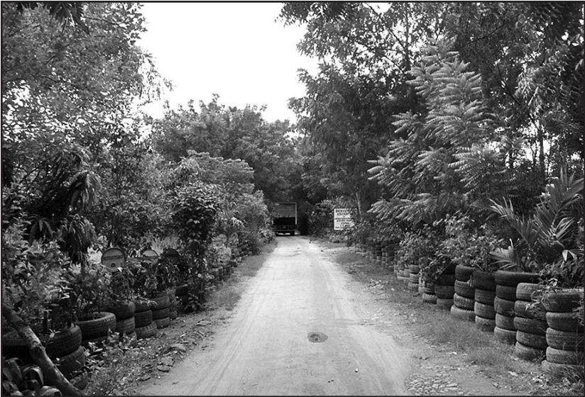
Hace unos años, esta bella arboleda era un agresivo vertedero.