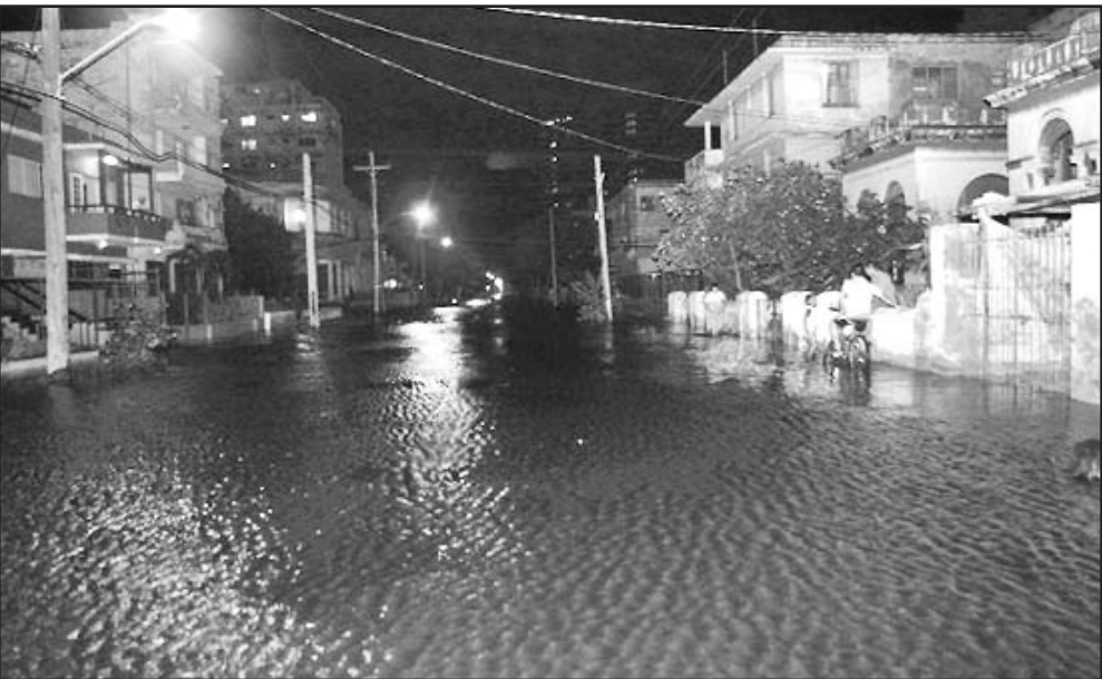
Tal y como advirtió el Estado Mayor de la Defensa Civil, anoche se produjeron penetraciones del mar en zonas costeras, sobre todo en áreas del Malecón.