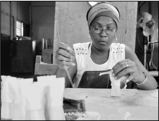
Aunque aún es muy pronto para evaluar los resultados, es gratificante el resurgir de las ventas artesanales en la industria local. trabajadores hacia otros terrenos como el cuentapropismo y el Fondo Nacional de Bienes Culturales y, además, la considerable disminución de la actividad arte