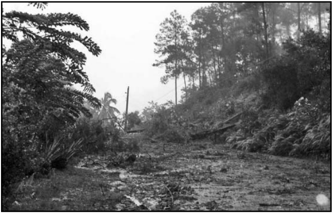
En La Farola fue impedido el tránsito por varias horas.

Ante los pronósticos de ocurrencia de fuertes marejadas con peligro para la navegación, e inundaciones costeras de moderadas a fuertes en la costa norte oriental, principalmente desde Punta Maternillos hasta Punta de Maisí, incluyendo el litoral de Baracoa, miles de personas han sido evacuadas en las provincias de Guantánamo y Holguín, la mayoría en viviendas de familiares y amigos; y los recursos fueron protegidos.