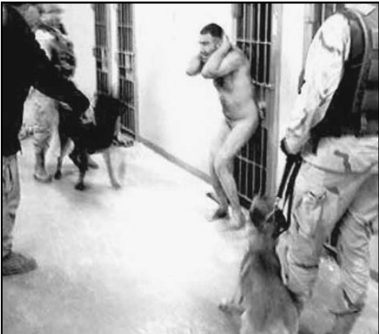
Tanto en la cárcel de la ilegal base de Guantánamo como en Iraq y Afganistán, las torturas han predominado como doctrina de Washington.

otros países se sumaron al reclamo de respeto de los derechos humanos por parte de Estados Unidos.