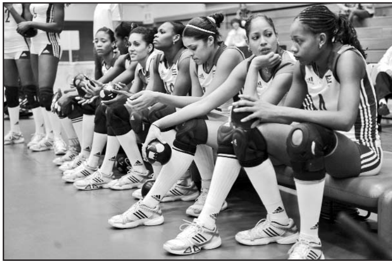
Las cubanas no tienen una fácil tarea en esta segunda vuelta.

En esta misma llave, rivalizarán Holanda-Tailandia, Italia-Estados Unidos y Alemania-República Checa. En la E, estarán opuestas Perú-Sudcorea, Polonia-Rusia, Serbia-China y Japón-Turquía.