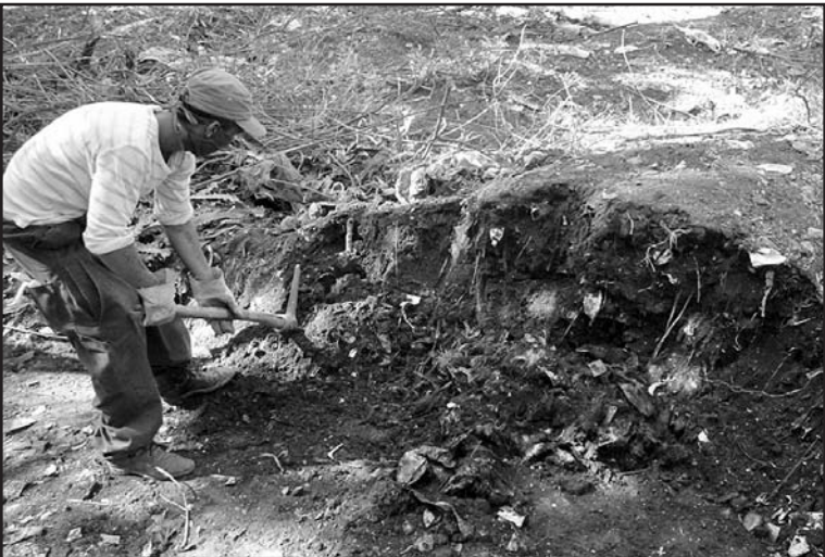
La producción de abono orgánico se destina a mejorar los suelos, y rehabilitar ecosistemas degradados.