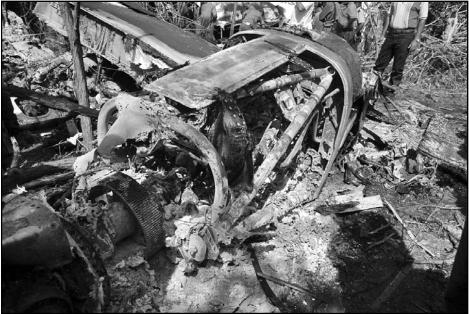
Los vecinos del lugar jugaron un activo papel en la localización de la aeronave.

Encontradas cajas negras de la aeronave ATR-72-212 Las cajas negra y de voz de la nave accidentada el jueves en la provincia de Sancti Spiritus fueron encontradas, por lo que la investigación en curso dispondrá de elementos básicos para su labor.