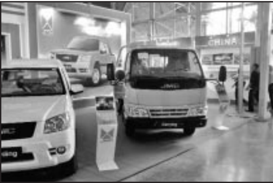
Automóviles, herramientas de ferretería, electrodomésticos... integran la muestra expositiva de la delegación china, representada por más de 30 empresas.

La VIII sesión del Comité Empresarial Cuba-China, constituido desde el 2003 con el propósito de fomentar los vínculos económicos, los servicios y las inversiones entre ambas repúblicas, distinguió la quinta jornada de la 28 FERIA Internacional de La Habana (FIHAV 2010). Durante el encuentro, Orlando Hernández, viceministro primero de Comercio Exterior y la Inversión Extranjera (MINCEX), destacó el aporte del país asiático al desarrollo de la economía nacional, lo cual lo sitúa como nuestro segundo socio, después de Venezuela, con un 14% de intercambio comercial. Mientras, la mayor de las Antillas ocupa el décimo puesto en los convenios de China con América Latina. De “crecientes y favorables” calificó la embajadora Liu Yuqin las negociaciones, las cuales, en el primer semestre del 2010, muestran un aumento del 34% respecto a igual periodo del año anterior. La ejecución de 11 negocios conjuntos que incluyen inversiones en las telecomunicaciones, la agricultura, el turismo y la industria ligera, así como la construcción en suelo chino de tres hospitales oftalmológicos y dos empresas biofarmacéuticas, fue reconocida por Estrella Madrigal, presidenta de la Cámara de Comercio de la República de Cuba.