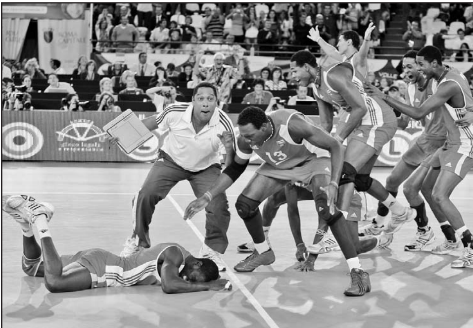
El elenco masculino de voleibol demostró estar a gran altura con su plata mundial.

Realmente difícil y agotador este recorrido de la mano de los mejores exponentes cubanos del deporte en el 2010. Sin duda, en muchos de estos nombres estarán cifradas nuestras esperanzas de triunfo en los Juegos Olímpicos de Londres'12. A los que resulten premiados, felicidades y enhorabuena.