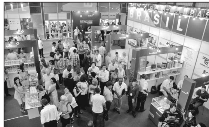
Además de promover los vínculos comerciales FIHAV 2010 consolida la integración latinoamericana.

Entre los países pertenecientes a ese bloque regional destaca Francia, sexto socio comercial de nuestro país, cuya presencia en FIHAV 2010 con más de 20 empresas vinculadas a la industria automovilística, la energía renovable, la agricultura y los alimentos, fortalece los nexos bilaterales.