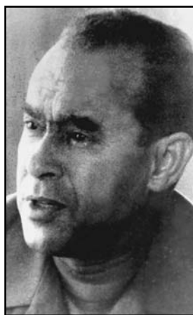
Mehdi Ben Barka.

El dirigente marroquí resistió con la misma entereza con que promulgaba sus ideas revolucionarias. Por eso aún es recordado entre las figuras más descollantes del movimiento libertario mundial.