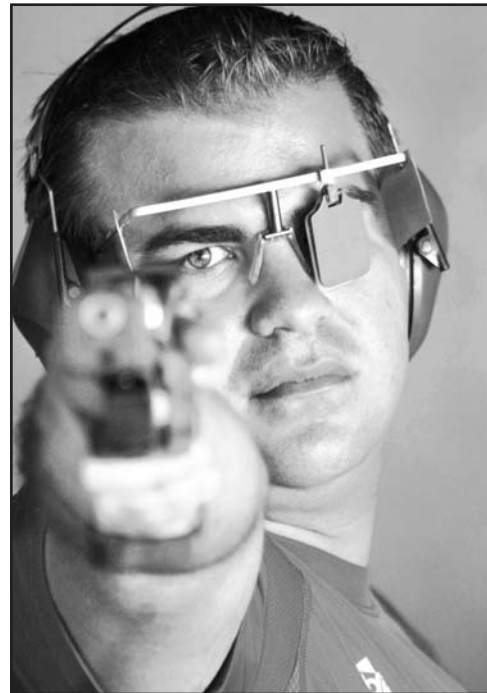
A Pupo la pistola le parece una extensión de su mano.

Los blancos están, solo les resta realizar certeros disparos.