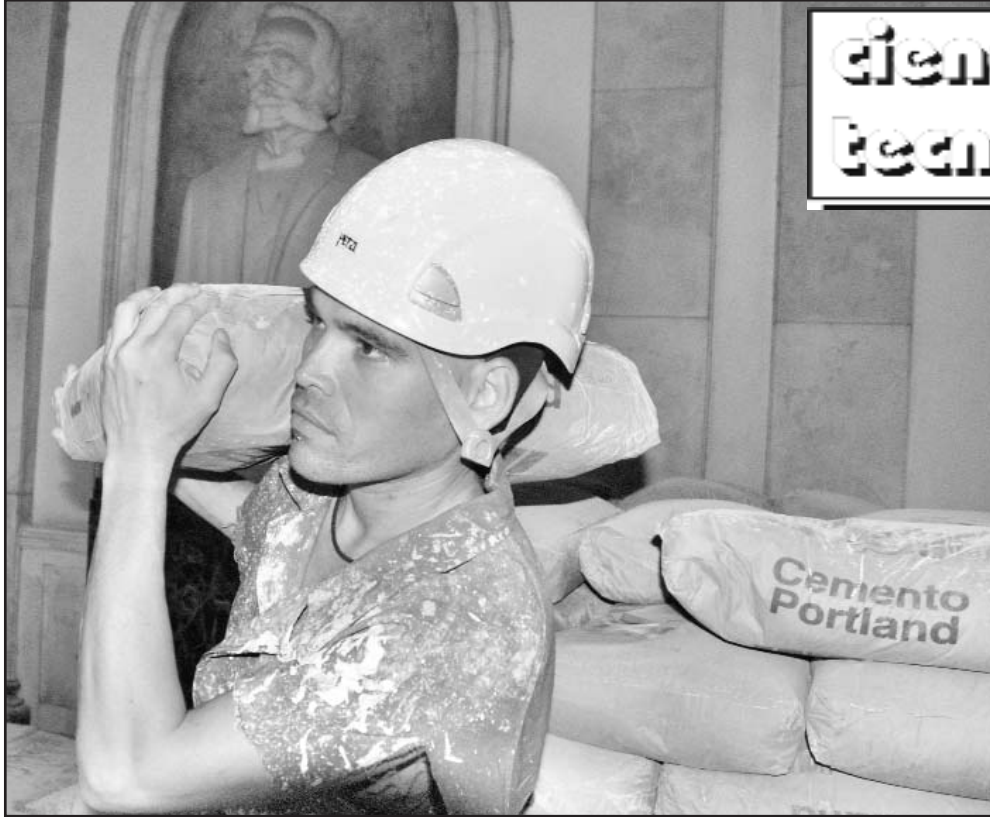
Los trabajos para rescatar el emblemático inmueble comenzaron en enero del 2009.