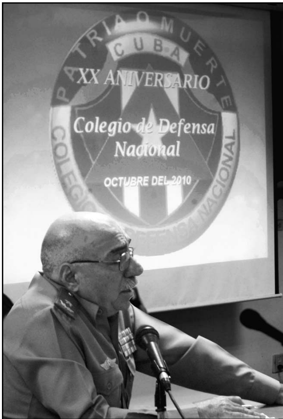
La preparación de cuadros civiles y militares en las cuestiones relacionadas con la seguridad y defensa nacional es el objetivo del CODEN, aseguró su director, el general de brigada Reinaldo Gómez Cuevas.