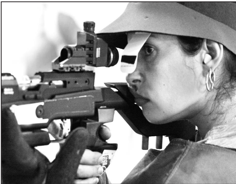
Eglys ansía otra alegría en Londres, como Beijing y la maternidad.

“Siempre va con la única opción de ganar, ahora está muy