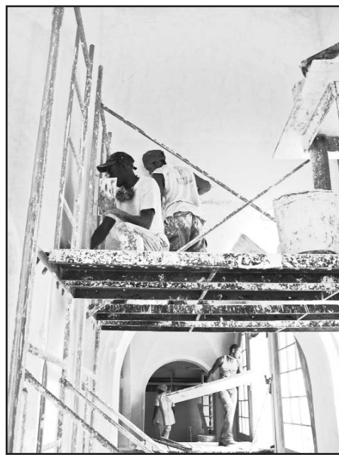
La condición de Patrimonio Nacional que ostenta el edificio exige la máxima calidad en cada detalle de la restauración.