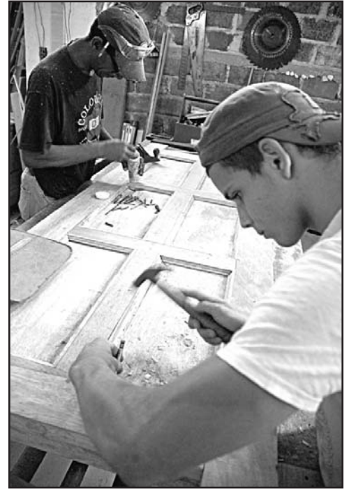
En la actualidad se labora en la carpintería de puertas y ventanas.