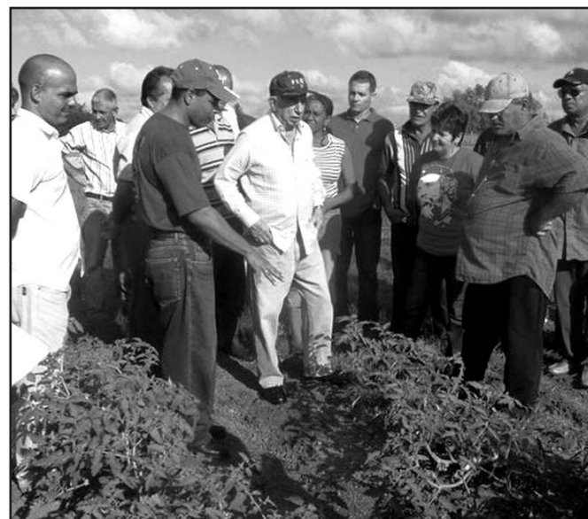
Durante su recorrido, Machado conversó con varios obreros agrícolas.

Machado Ventura fue informado de la actividad agroindustrial frutícola que, aunque por debajo de la capacidad de molienda de la fábrica, hoy produce 20 surtidos destinados en un menor por ciento al mercado de divisas en frontera,