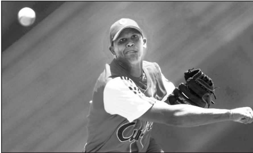
Vera está listo para lanzar mañana.