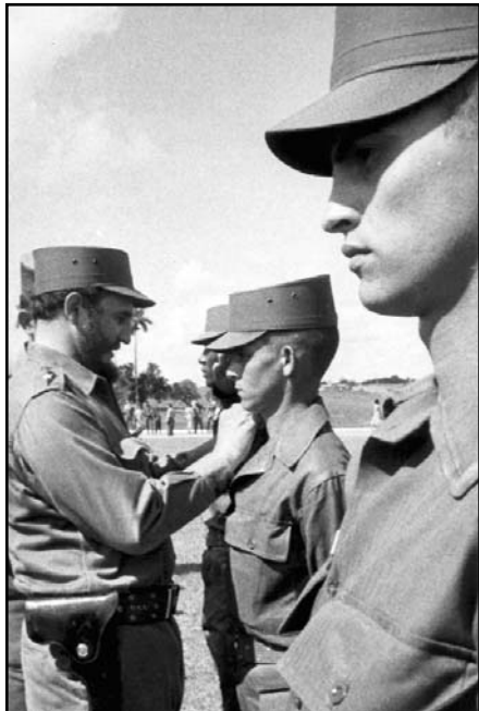
Fidel ascendió a los cadetes.

Allí Fidel destacó: “Para nosotros esto significa un triunfo más. (...) graduar hoy 55 Oficiales, en la Escuela de Oficiales del Ejército Rebelde, se debe, en gran parte, al esfuerzo de un grupo de militares honestos que aportaron a la Revolución su experien-