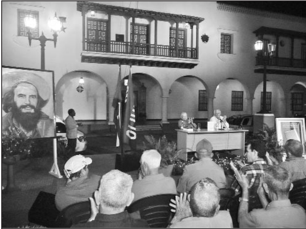
El texto ofrece una explicación detallada sobre las acciones que condujeron a la victoria, con fotos, mapas y documentos de valor testimonial.