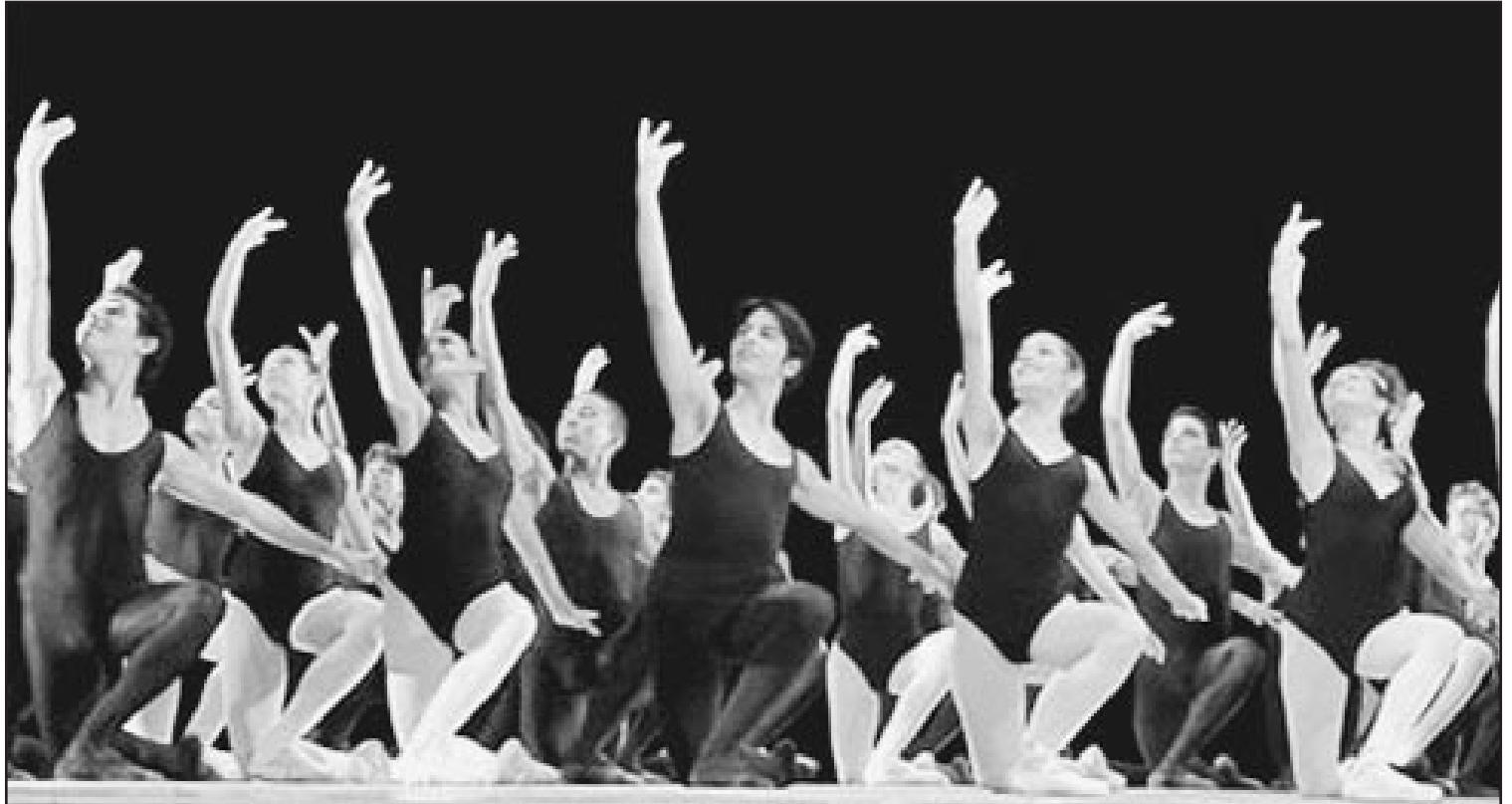
La continuidad generacional es piedra angular en el desarrollo del Festival.

Los años 1966 y 1967 continuaron la vida del Festival, que recesó a partir de entonces durante siete años, periodo en que los Alonso concentrarían sus mayores esfuerzos en consolidar al Ballet Nacional de Cuba como uno de los conjuntos danzarios de mayor jerarquía internacional, cuyo elenco fue nutrido desde 1968 por los egresados de la Escuela Nacional de Ballet. El 2 de noviembre de 1974, el Festival reinició