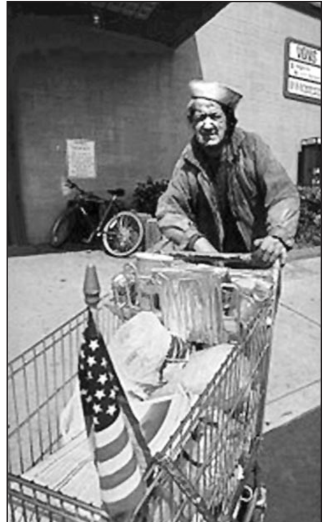
Estados Unidos ha pasado en solo diez años del puesto 24 al 49 en la clasificación mundial de esperanza de vida, según estudios de la Universidad estadounidense de Columbia y la Organización Mundial de la Salud.

Hay muchas estadísticas e informes que hablan de un país que está despeñándose rápidamente, en ámbitos que van desde la escasa estabilidad del sistema bancario, a la drástica reducción del transporte público. En las ciudades y las poblaciones menores, para hacer frente a la crisis se suprimen líneas enteras de autobuses y trenes. Las investigaciones apun-