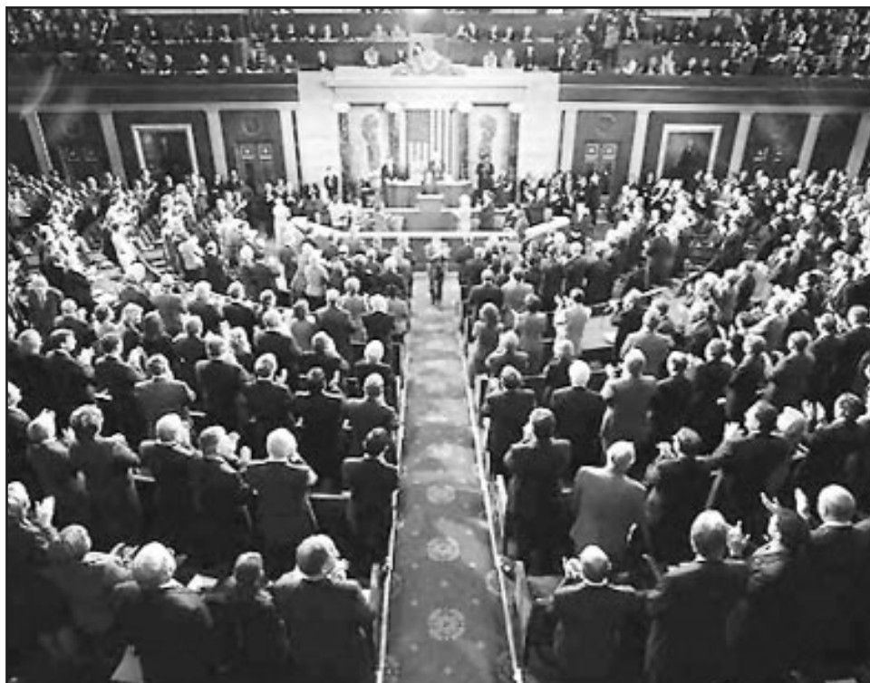
Las elecciones del próximo 2 de noviembre ponen en juego los puestos de los 435 miembros que integran la Cámara de Representantes y la tercera parte del Senado del Congreso de los EE.UU.

La esencia está en el caos económico, social y político del actual momento histórico de la sociedad norteamericana. En la campaña electoral del 2008, Obama captó la imaginación y la voluntad de millones de norteamericanos con la consigna de cambios consecuentes