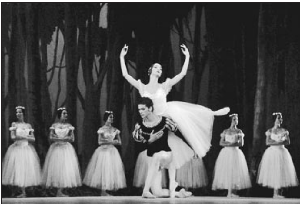
La Escuela Cubana de Ballet muestra su pujanza en cada evento.

Desde ayer 28 de octubre —día del 62 aniversario de la fundación del Ballet Nacional de Cuba y hasta el 7 de noviembre del presente 2010, esta vez enmarcado en los festejos por las nueve décadas de vida de la legendaria Alicia Alonso, máxima inspiradora del evento—, el Festival Internacional de Ballet de La Habana vuelve a acaparar la atención mundial como una cita de arte y amistad, propiciada por el maravilloso y universal lenguaje de la danza.