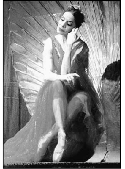
Al genio creador de Alicia Alonso, en sus 90 años de vida, estará dedicado el Festival.

Al Festival, que se extenderá hasta el domingo 7 de noviembre, asistirán artistas y compañías de 18 países, incluyendo al célebre American Ballet Theater, de Estados Unidos.