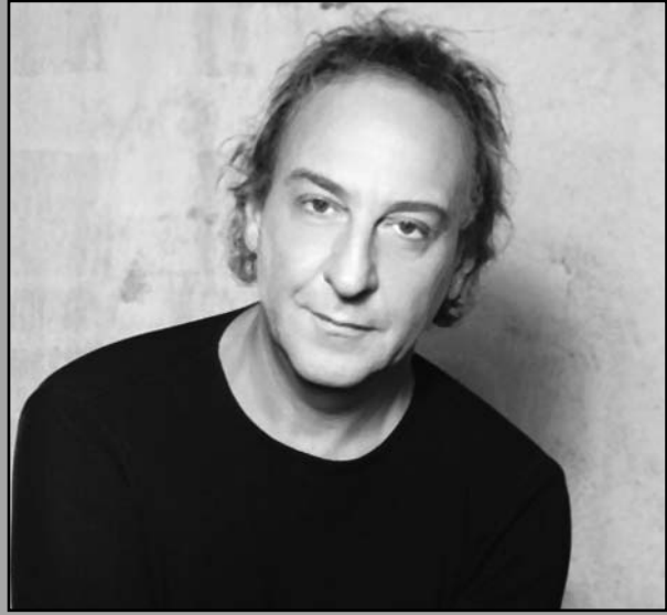
El compositor argentino Osvaldo Montes, presencia especial en la Fiesta holguinera.