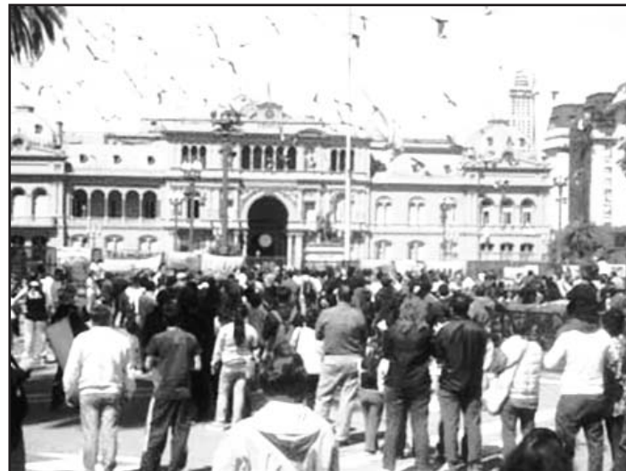
La muerte repentina del ex presidente argentino Néstor Kirchner, el político más influyente del país, ha conmovido a los argentinos, quienes se congregan por centenares frente a la Casa de Gobierno en Buenos Aires.

Según un despacho de EFE, el presidente dominicano, Leonel Fernández, calificó a Kirchner como "propulsor de la integración