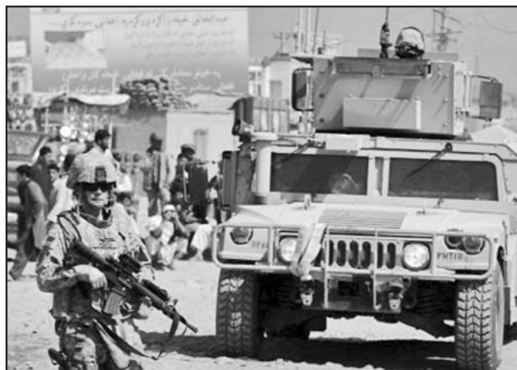
Wikileaks revelará nuevas atrocidades de tropas norteamericanas en Iraq.