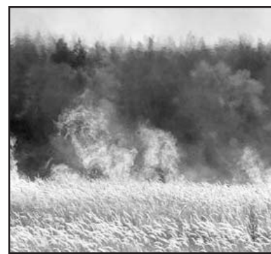
Rusia frenó la exportación de granos debido a una intensa sequía y una ola de calor, que provocó numerosos incendios. Esos fenómenos dañaron las cosechas.

Los expertos temen que Moscú pierda su posición en el mercado mundial. El año pasado Rusia cosechó 97 millones de toneladas de granos y vendió al exterior 20 millones. (DPA)