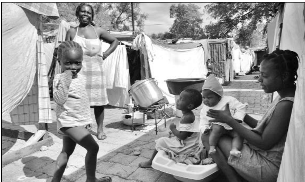
La atención de la salud a las mujeres haitianas es uno de los múltiples desafíos que enfrenta la nación caribeña.

■ LETICIA MARTÍNEZ HERNÁNDEZ Enviada especial