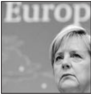
Angela Merkel ha sido blanco de críticas por sus declaraciones contra la integración de los inmigrantes en Alemania.

BERLÍN, 20 de octubre.—Partidos de oposición y organizaciones no gubernamentales en Alemania, acrecentaron hoy sus críticas a las posiciones xenófobas dentro de la coalición gubernamental de la canciller, Angela Merkel, en materia de política migratoria. Según la diputada socialista Ulla Jelpke, el Gobierno agudiza el ambiente xenóforo y racista que ya existe en Alemania.