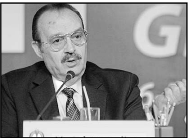
Esperan soluciones rápidas a los problemas existentes con algunas de las instalaciones de los Panamericanos'11, afirmó Vázquez Raña.

ACAPULCO, México.—El presidente Felipe Calderón participó ayer en la inauguración de la XVII Asamblea General de la Asociación de Comités Olímpicos Nacionales (ACNO), a la que asisten 205 delegaciones de países afiliados, incluidos ministros de deporte. El mandatario saludó al titular de la ACNO, el mexicano Mario Vázquez Raña, y al del Comité Olímpico Internacional (COI), Jacques Rogge. También destacó la presencia de miembros del COI, de dirigentes de Federaciones Internacionales, campeones olímpicos e invitados especiales. Calderón expresó que México ayudará a mejorar en temas trascendentes como la lucha contra el dopaje, e incrementará su influencia por alcanzar una sociedad más deportista y sana. La jornada de apertura de la Asamblea estuvo antecedida por reuniones de su Comité Ejecutivo, donde trascendió que Vázquez Raña aparece como candidato único a la reelección al frente de la organización. En este municipio del suroccidental estado de Guerrero se encuentran presentes,