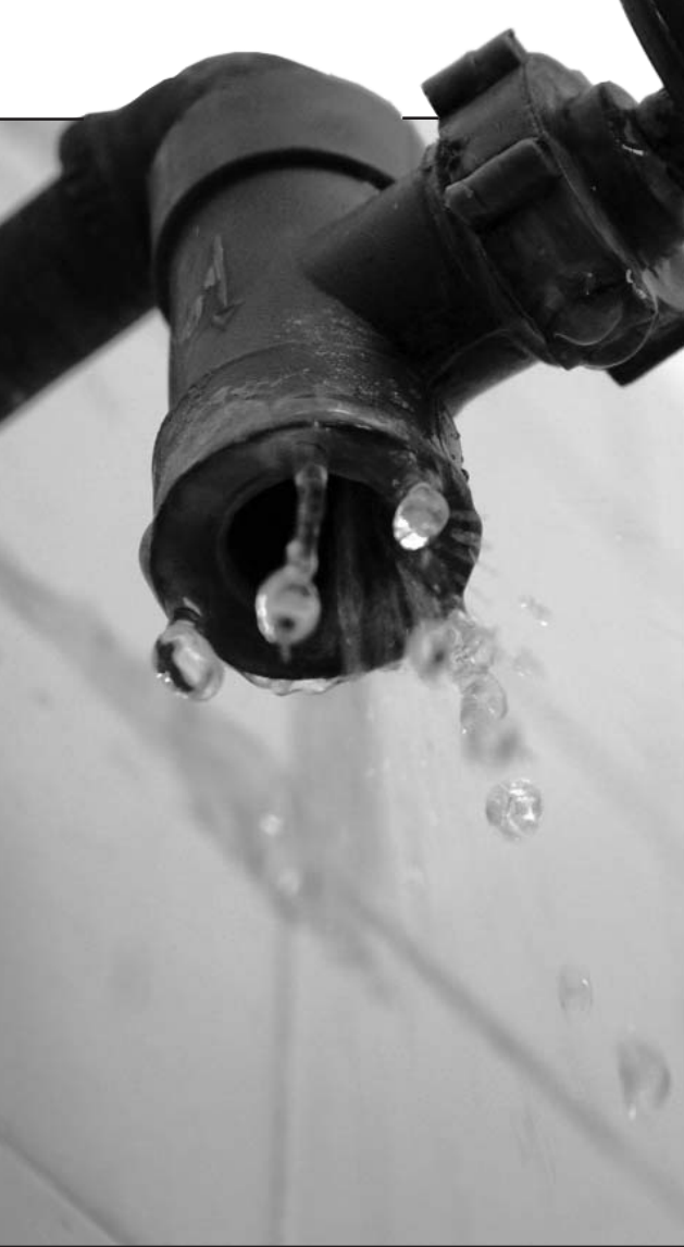
La indisciplina social sigue siendo un goteo continuo a favor del despilfarro de este recurso esencial.

CIEGO DE ÁVILA.—Por estos días, el agua se interpone en nuestro camino más de lo acostumbrado, lo mismo corriendo libremente que encharcándose en el menor desnivel. Se estima que en Cuba, el 60% del volumen bombeado, se pierde antes de llegar a los hogares. Para corroborarlo basta con asomarse a la ventana o prestar atención al continuo goteo de los tragantes de cualquier ciudad. Sin soslayar cuánto repercute en el desperdicio de agua el estado de los acueductos, en materia de ahorro de este recurso vital queda mucho por hacer: la indisciplina social tiene aún un peso importante en el derroche y las empresas hacen “uso y abuso” del recurso. En medio de este complejo panorama, Ciego de Ávila da ejemplos de terreno ganado en materia de control y planificación del líquido, al despuntar como referente nacional con métodos regulatorios.