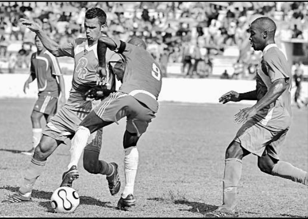
Pinar del Río sumó su primer tanto del certamen, tras un empate sin goles con los anfitriones.

además, integrantes de los comités organizadores de los Juegos Olímpicos de Verano Londres 2012, Río de Janeiro 2016 y de Invierno 2014, quienes ofrecerán a los miembros de la ACNO una panorámica de cómo marchan los preparativos para esos certámenes. El titular de la ACNO, que a su vez encabeza la Organización Deportiva Panamericana (ODEPA), informó que en la reunión con el Comité Organizador de los Juegos Panamericanos de Guadalajara 2011 se abordarán problemas que aún existen con el estadio de atletismo, la villa, el laboratorio de dopaje y la señales de televisión. Agregó que esperan por rápidas soluciones para resolver esas dificultades, por lo cual la Asamblea General de la ODEPA analizará como punto central la situación real de los juegos hemisféricos, a un año de su realización. Durante la reunión general de la ACNO, cuyo temario abarca 24 puntos para debatir, se rendirá el informe de su dirección en cuanto a la gestión general realizada desde el anterior encuentro de este tipo. (PL)