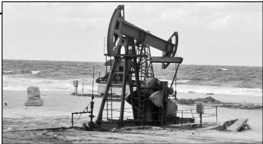
La industria del petróleo requiere de alta tecnología, pero el bloqueo dificulta su adquisición.