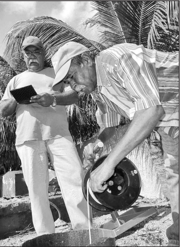
Los sistemas de Pronóstico de Nivel y el de Alerta y Alarma Tempranas permiten conocer el estado en que se encuentran los acuíferos.