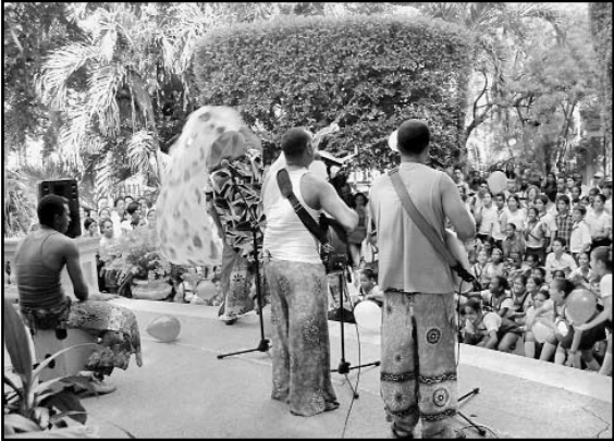
Público de todas las edades disfrutó la jornada de ayer en la sede de la UNEAC.

La trascendental victoria del Ejército Libertador, a solo diez días de iniciada la lucha en La Demajagua, fue rememorada en Bayamo este 20 de Octubre, en ocasión del aniversario 142 de la toma de la villa oriental por tropas bajo el mando de