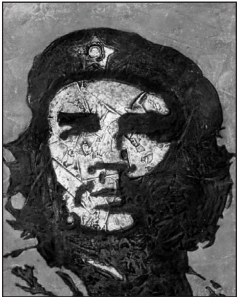
Che comandante, amigo, colografía de Eduardo Roca (Choco).