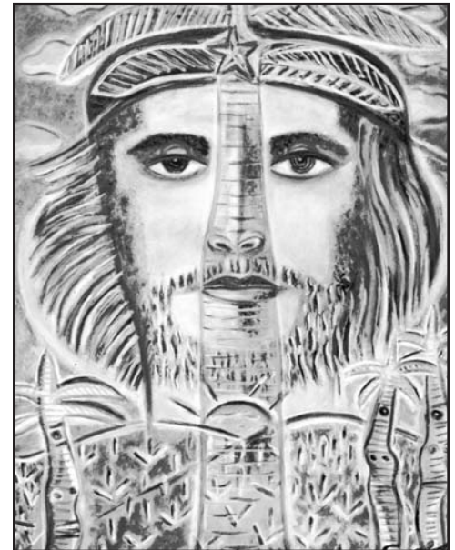
Che, montaña de gloria, de Ever Fonseca.