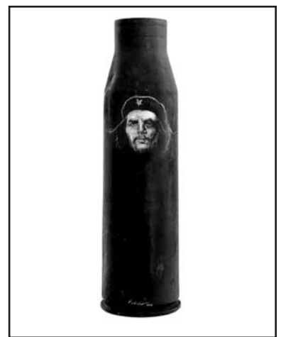
Con su cañón de futuro, de Roberto Fabelo, técnica mixta sobre un casquillo de bala de cañón.

“Su foto del Che, convertida en bandera, no es su único legado, pero esa sola imagen bastaría para situarlo entre los profetas de su tiempo. Él vio entonces lo que nadie: el rostro del futuro, la rebeldía de los pueblos, la irremediable lucha de los revolucionarios de todo el mundo por conquistar el porvenir.”