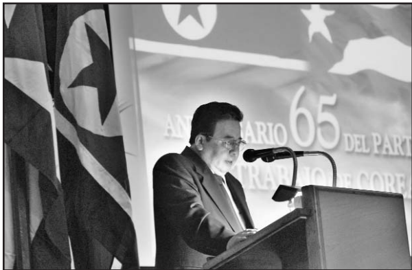
El embajador Kwon Sung Chol destacó los logros de la RPDC en estos 65 años de creado el Partido del Trabajo.