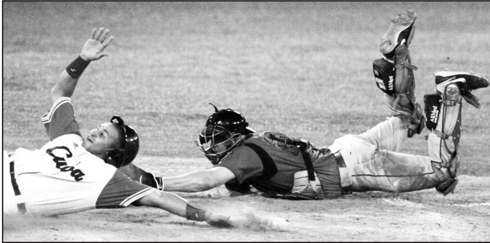
La escuadra antillana sumó ante Canadá su cuarto éxito en línea.