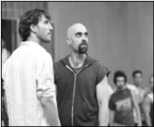
Celda 211 en las salas de estreno.

Celda 211 , filme español dirigido por Daniel Monzón, que resultara el más galardonado en los pasados Premios Goya, se estrena desde ayer en Acapulco, Payret, Alameda, Lido, Ambassador, Regla, Continental y las principales salas de todo el país.