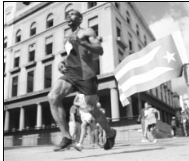
A la carrera asistieron personas de todas las edades.