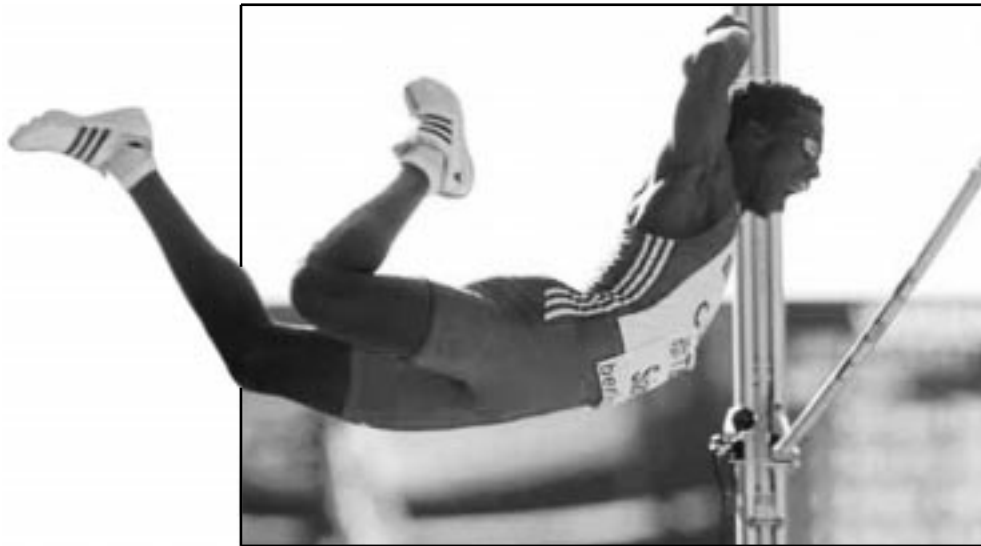
El holguinero consiguió puntuaciones superiores a 800 en siete de las 10 pruebas, incluida la pértiga con salto de 4.66 metros.