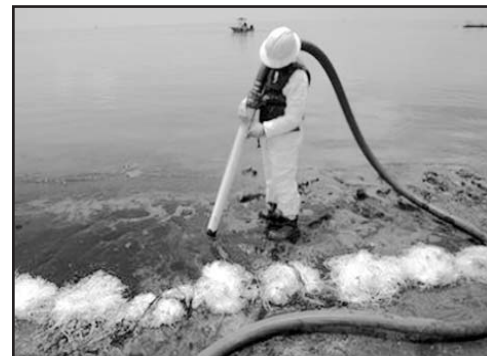
Aún es incalculable el tiempo que debe transcurrir para que la costa del Golfo se recupere completamente de este desastre.

Un incendio forestal ardía fuera de control a través de una gran franja de un parque nacional cercano a Brasilia, la capital. El fuego se sospecha fue iniciado deliberadamente en el parque conocido como Agua Mineral. Nadie ha resultado herido y ninguna propiedad privada está en riesgo por el momento. El parque de 30 000 hectáreas está al noroeste de la capital, a un par de kilómetros de la localidad más cercana y a 12 kilómetros de los principales edificios de Gobierno. (AFP)