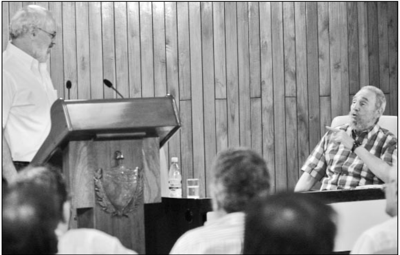
Fidel dialoga con Alan Robock.