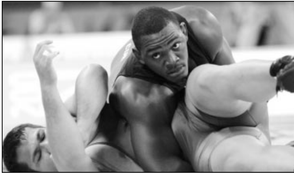
En su reaparición, Mijaín no defraudó y se alzó invicto con su cuarta corona.

Esta vez, Mijaín no tuvo que medirse ni al local Kazham Baroev ni al turco Riza Kayaalp, el otro bronceado, sus más encarnados rivales de los últimos años, quienes