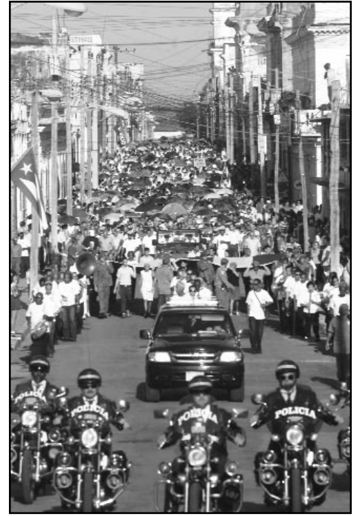
En peregrinación el pueblo cienfueguero marchó por las calles hasta el cementerio Tomás Acea.

El dirigente partidista señaló que a la efeméride se llega con un saldo productivo favorable, toda vez que hay reporte de sobrecumplimiento de la producción mercantil, se eleva el bienestar de la población con obras de beneficio social y se incre-